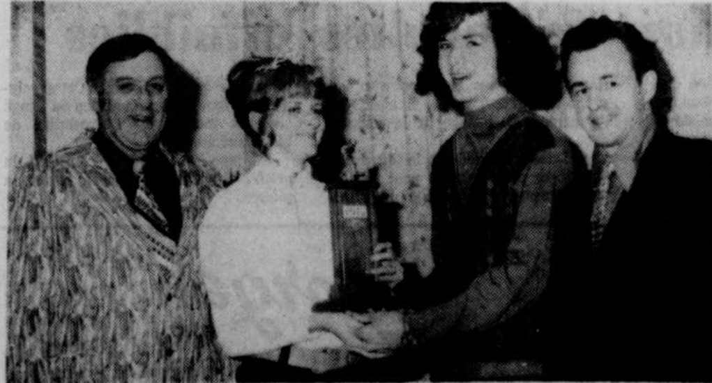
L'organisation du carnaval de Dixville a tenu à donner un signe tangible d'appréciation à l'équipe Junior de Dixville qui a disputé une vingtaine de parties de hockey à l'extérieur et n'a connu la défaite que deux fois contre Compton et Coaticook.