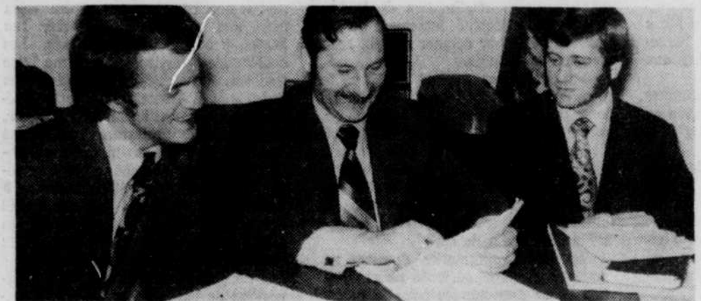
Coopération Affaires-Jeunesse: Il s'agit d'un projet d'initiative locale créé il y a quelques mois dans le but de convertir le monde du travail en une expression que tous les étudiants peuvent comprendre et accepter.

sur les activités syndicales, les chaînes de montage, les différents secteurs de l'activité économique et de services (judiciaires, manufacturiers, ou autres).