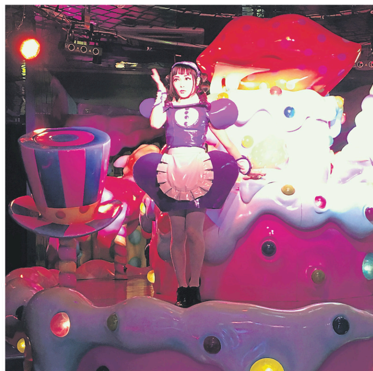
Le Kawaii Monster Cafe de Tokyo est un restaurant complètement déjanté où le bruit et la couleur sont abondants. Des spectacles y sont aussi présentés sur un immense gâteau qui sert d'élément central dans le décor.

Le journaliste était l'invité du Foreign Press Center Japan