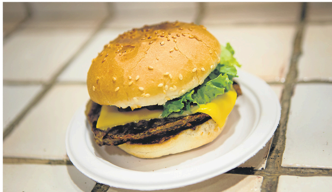
On parle de malbouffe à l'émission Point doc/Malbouffe sans frontières , le mercredi 21 mars, 20 h, à Télé-Québec. —