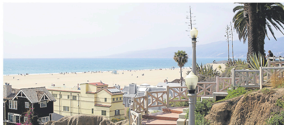
Vue de la plage de Santa Monica

Le centre-ville de Los Angeles a connu des transformations majeures au cours des dernières années, ce qui en fait une destination à (re)découvrir. Parmi les attractions principales, le Walt