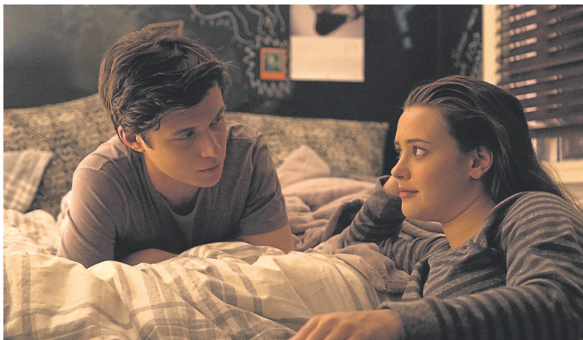
Nick Robinson et Katherine Langford dans les rôles de Simon et de sa meilleure amie Leah.

Le cinéaste joue la carte du merveilleux à la Disney où tout le monde est beau et gentil : parents, professeurs, directeurs et amis sont tous sensibles, empathiques