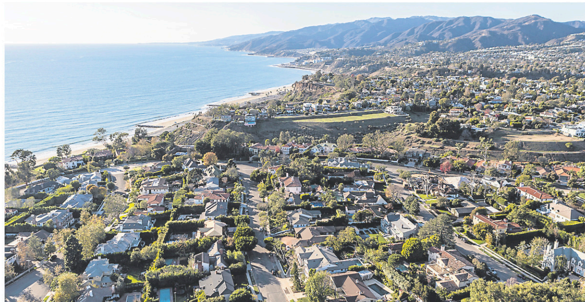
Pacific Palisades

www.laparks.org/griffithparkwrepubliquela.com