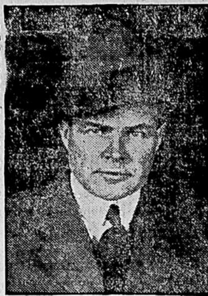
E. W. BEATTY Le nouveau président du C.P.R.

"Mais, demandions-nous à M. Beatty, comment transporter tous ces soldats réformés? Pensez-vous que la nationalisation du Pacifique Canadien pourra contribuer à la solution de ce grand problème?"