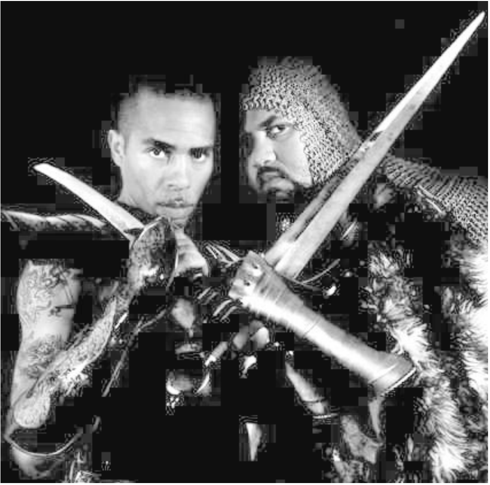
Faf La Rage et Shurik'n ont des voix graveleuses semblables, quelques airs de famille, mais le plus jeune est aussi plus costaud.