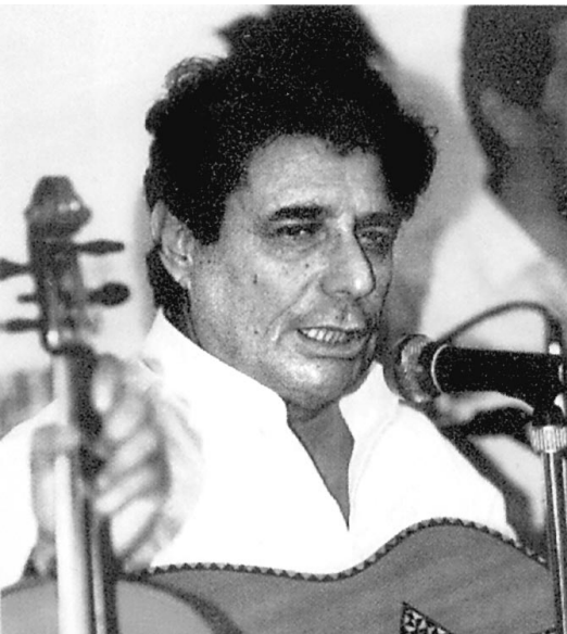
El Hachemi Guerouabi

Plusieurs jours avant son concert, le chanteur est débarqué à Québec. On l'a hébergé au fin fond de... Laval. L'autoroute 15 sous une pluie torrentielle et sur des pneus d'hiver flambant neufs. Ainsi chaussée, la bagnole emprunte le boulevard Sainte-Rose. Je n'aboutis pas dans un souk, vous vous en doutez bien, mais bien dans un classique bungalow affublé d'un abri Tempo. Un homme m'y accueille chaleureusement, me conduit à la salle à manger. Il y a tout plein d'hommes, tous en sandales. La table débordée de fruits, noix, makrouts au miel, bakours à la pâte d'amande et autres sucreries maghrébines. Les hommes se taisent, prêts à assister à l'interview de leur idole, sexagénaire cool, affable et souriant. Cette pièce est remplie de respect, je vous dis.