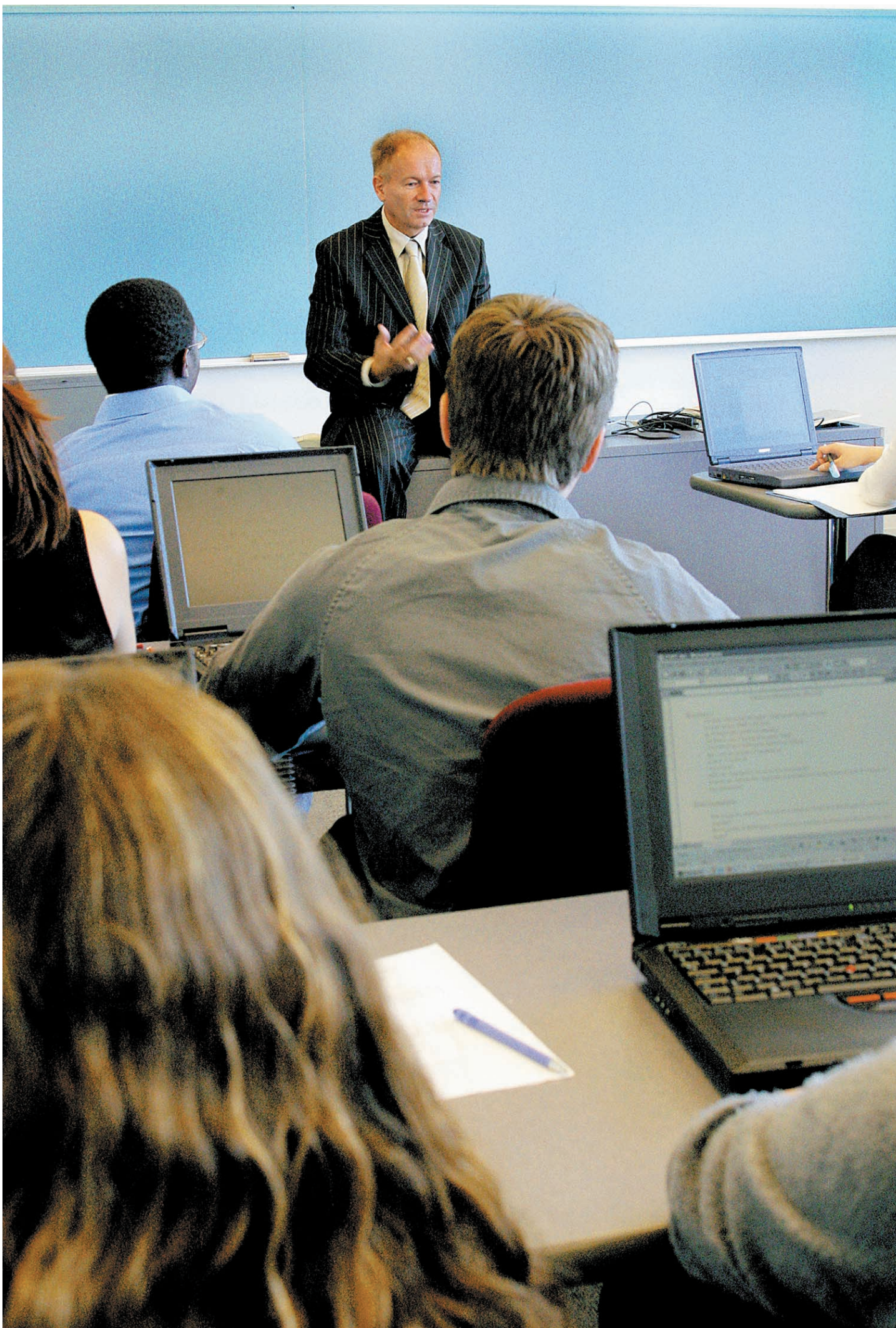
Ce n'est pas d'hier que les étudiants qui s'ennuient pendant un cours choisissent de porter leur attention ailleurs. Mais avec Internet et les ordinateurs portables, la tentation s'est démultipliée.