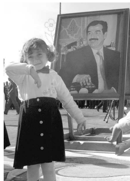
Un pas de danse à Bagdad, sous l'oeil du président.

Comme les autres écoles de danse du monde, les élèves de l'École de musique et d'art de Bagdad préparent un spectacle de fin d'année. À cette différence près qu'elles ne savent pas si la représentation aura lieu au milieu des bombes et des missiles.