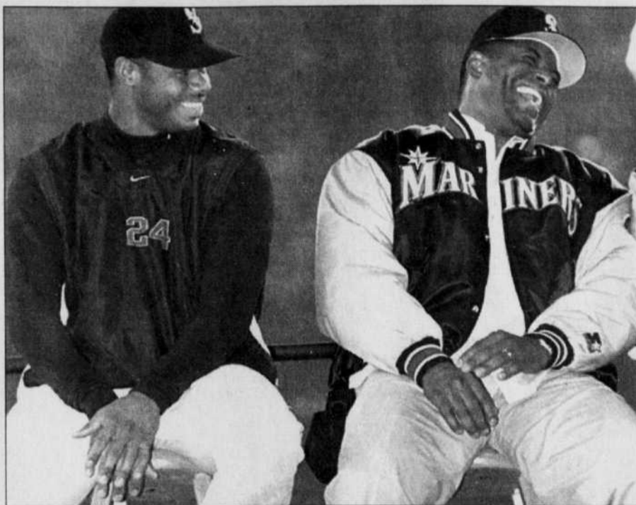
Ken Griffey fils rigolait déjà avec son papa lorsqu'il portait le chandail des Mariners. Ce n'est pas le contrat accepté hier qui lui fera perdre cette bonne humeur.

Les Mariners, cependant, entretenaient peu d'espoir de retenir les services de Griffey fils