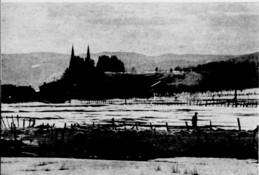
L'île aux Coudres

■ À l'occasion des fêtes de Pâques, le réseau français de radio présentera à ses auditeurs quelques émissions en rapport avec la liturgie chrétienne et avec les traditions catholiques.