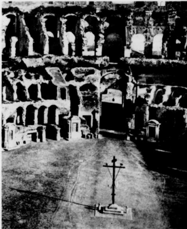
Le Colisée, où pouvaient s'entasser 50,000 spectateurs, a vu mourir Polyeucte.