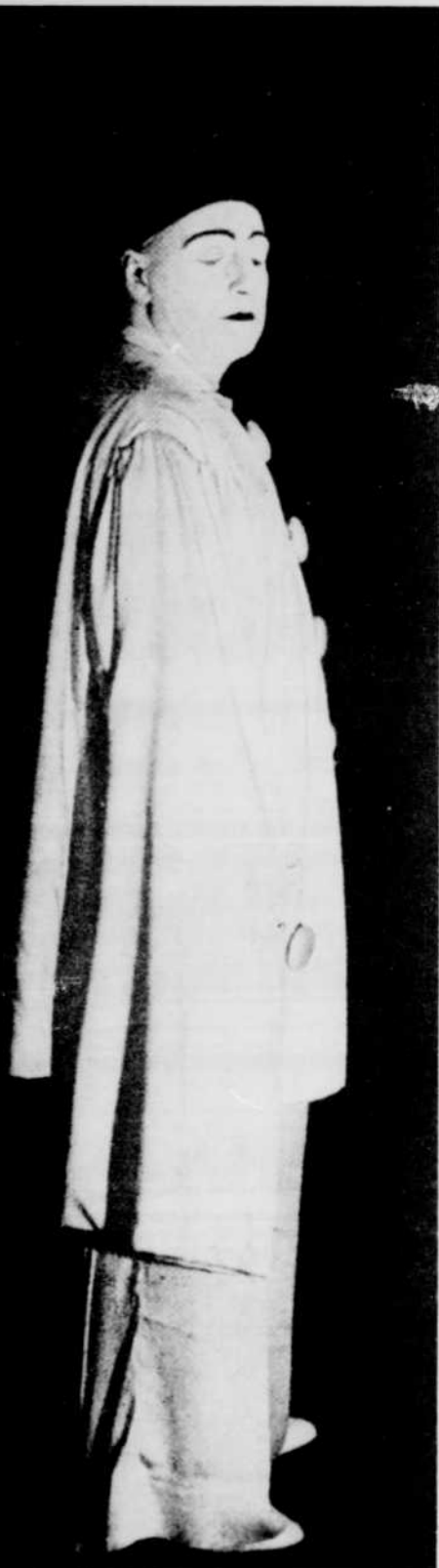
Sacha Guitry dans « Deburau ».

Sacha Guitry, également, laisse transparaître dans Deburau son grand amour du théâtre. Un critique a dit de cette pièce: « On a fait plus noble et plus profond; on n'a pas fait plus joli. » Chacun sait que Sacha Guitry n'est pas de ces auteurs appelés sérieux parce qu'ils manquent d'esprit. Loin de là! Il le prouve ici plus que jamais. La langue poétique qu'il emploie et dont il maîtrise si bien les vers qui suivent le mouvement du débit naturel, atteint à la forme classique par sa sobriété et la justesse de son expression. Une plume légère au service d'un thème d'où ressort une humanité d'autant plus touchante qu'elle n'a rien de didactique: voilà le style que l'auteur a employé pour écrire Deburau . Et ce style ne fait qu'un avec Guitry.