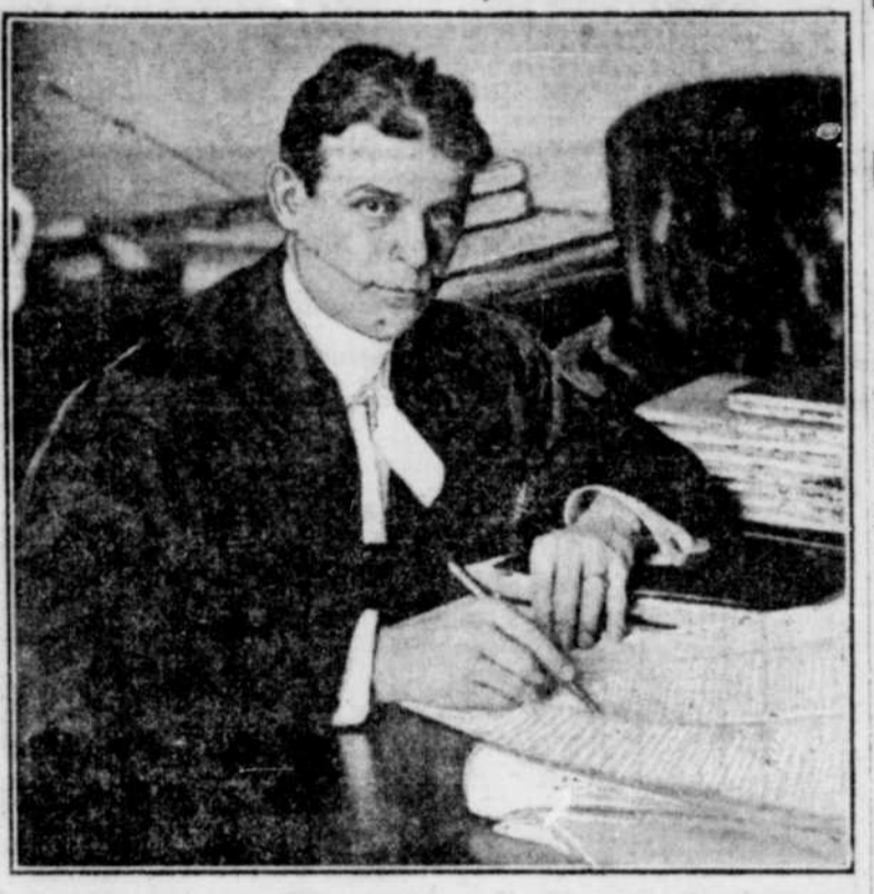
L'HONORABLE JUGE J.-A. DESY, qui a prononcé les sentences à la Cour d'assises dont le terme vient de prendre fin. Le distingué magistrat a bien voulu poser ce matin devant l'objectif du photographe de la "Presse", dans son bureau, au palais de justice.