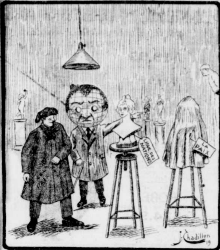
Le Monde.—C'est la paix que je veux la première.