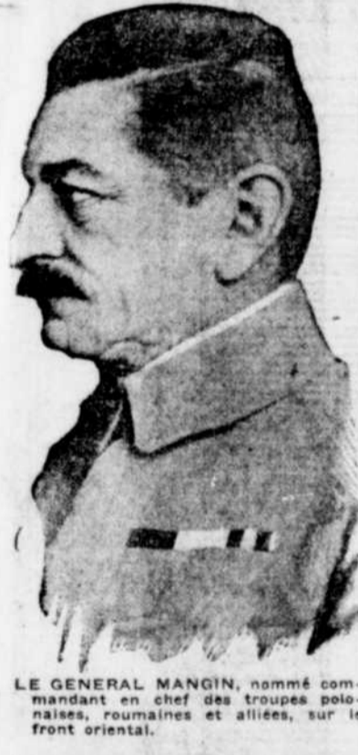
LE GENERAL MANGIN, nommé commandant en chef des troupes polonaises, roumaines et alliées, sur le front oriental.