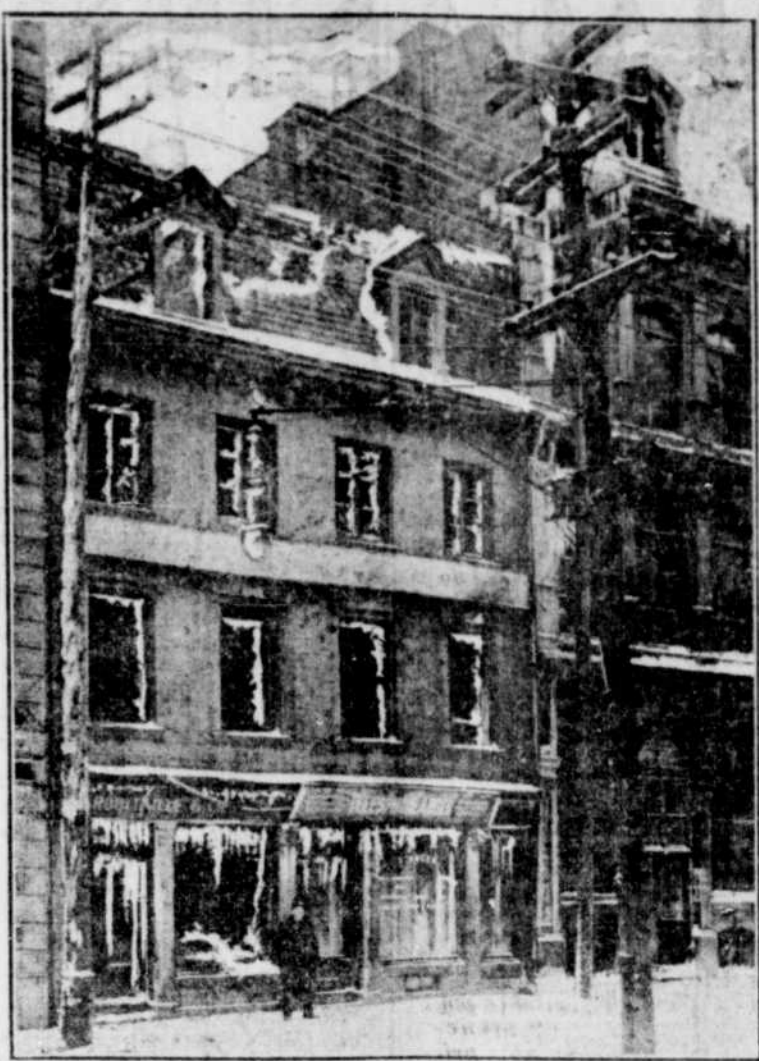
La maison d'importations Stanislas Robitaille & Co., rue Saint-Paul-Est, qui a été incendiée hier soir. Les pertes se chiffrent à environ $100,000. (Détails ailleurs).—Cliché du photographe de la "Presse".