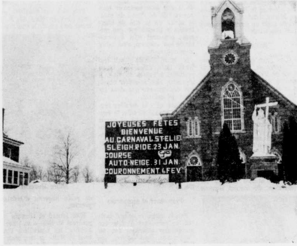
Un panneau a été installé à St-Elie d'Orford pour annoncer le carnaval qui s'y déroulera bientôt.