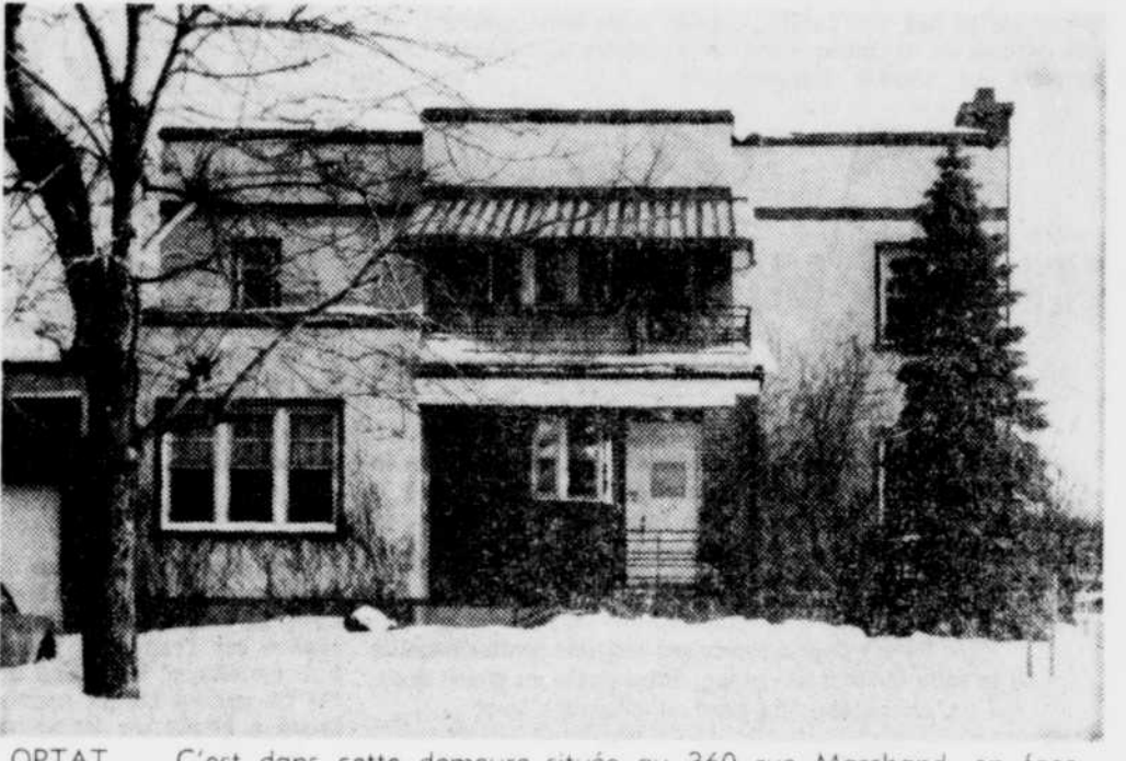
OPTAT — C'est dans cette demeure située au 360 rue Marchand, en face de l'édifice provincial, qu'a élu domicile le centre de consultation externe de l'OPTAT depuis quelque temps. On sait que le Centre de consultation externe est un organisme séparé du Centre d'accueil Domrémy.

Il s'agit du deuxième vol à main armée où les voleurs sont arrêtés immédiatement après leur méfait cette année dans la région de Drummondville.