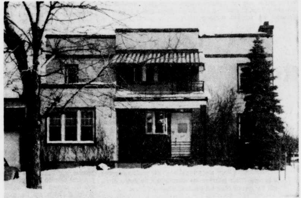
OPTAT — C'est dans cette demeure située au 360 rue Marchand, en face de l'édifice provincial, qu'a élu domicile le centre de consultation externe de l'OPTAT depuis quelque temps. On voit que le Centre de consultation externe est un organisme séparé du Centre d'accueil Domrémy.

Il s'agit du deuxième vol à main armée où les voleurs sont arrêtés immédiatement après leur méfait cette année dans la région de Drummondville.