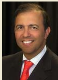
Sam Hamad Ministre de l'Emploi et de la Solidarité sociale