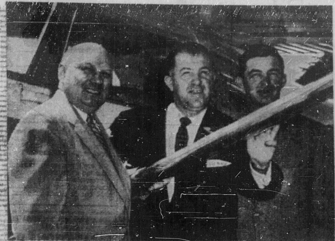
CAMPAGNE PAR AVION — Le comité de Nickel Belt est vaste et les candidats politiques doivent souvent se déplacer en avion s'ils veulent rencontrer tous leurs électeurs.