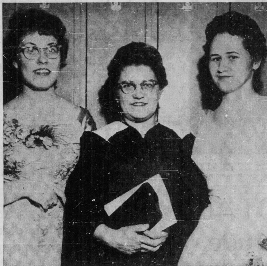
SUCCES D'ETUDIANTS — Près de 200 élèves ont obtenu leurs diplômes d'École secondaire au Nickel District Collegiate, 128 élèves ont obtenu leur diplôme général de l'École secondaire. Vingt-cinq étudiants ont obtenu leur diplôme au cours commercial, huit au

université j'irais premièrement voir comment vivait le travailleur au Canada. Je voulais comprendre l'ouvrier et son milieu avant de faire quoi que ce soit dans la vie. "Frontier College" m'a offert cette chance inespérée.