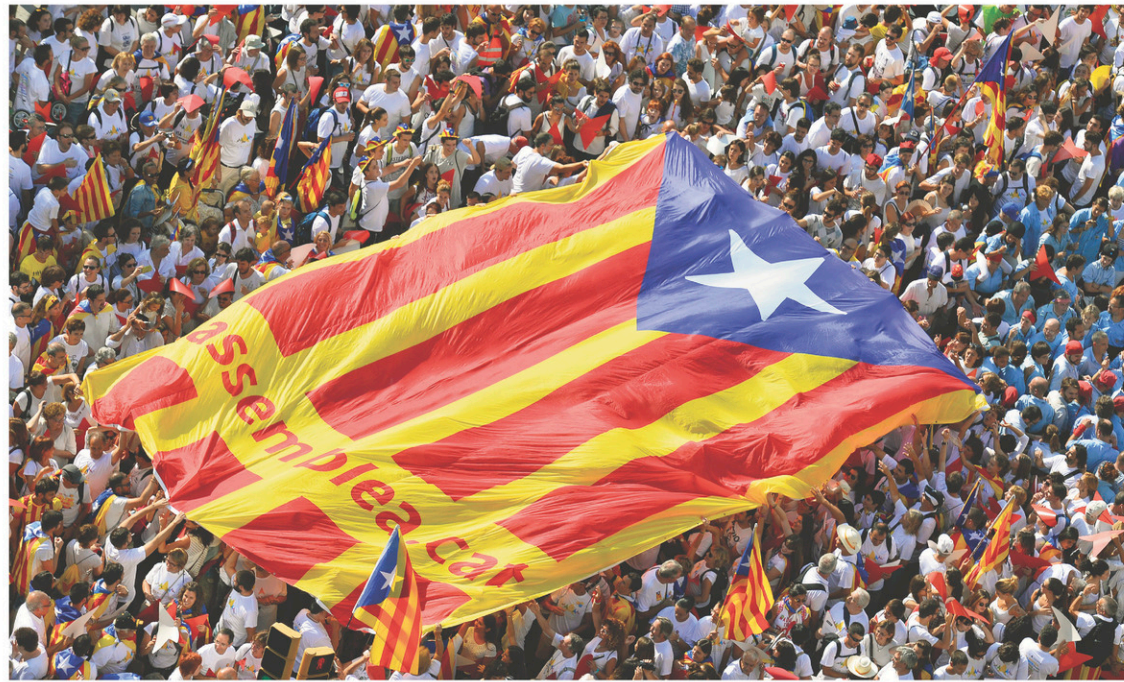
Le drapeau aux couleurs de « l'estelada », symbole de l'indépendance catalane, flottait au-dessus de milliers de manifestants séparatistes lors de la Diada à Barcelone le 11 septembre 2016.

« Il n'y aura pas de référendum, et je ferai tout le nécessaire pour cela, car c'est mon obligation »,