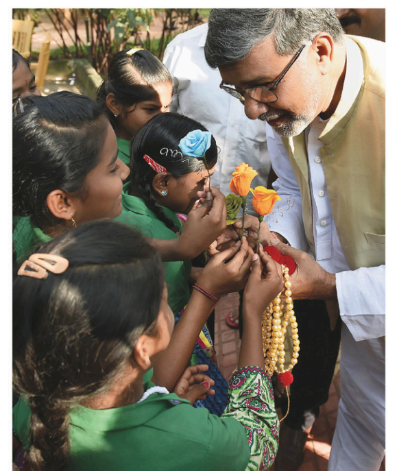
Kailash Satyarthi a été nobélisé en 2014.

M. Satyarthi est à l'avant-garde de la lutte contre le travail des enfants en Inde, qui, d'après l'UNICEF, touche plus de 10 millions d'entre eux.