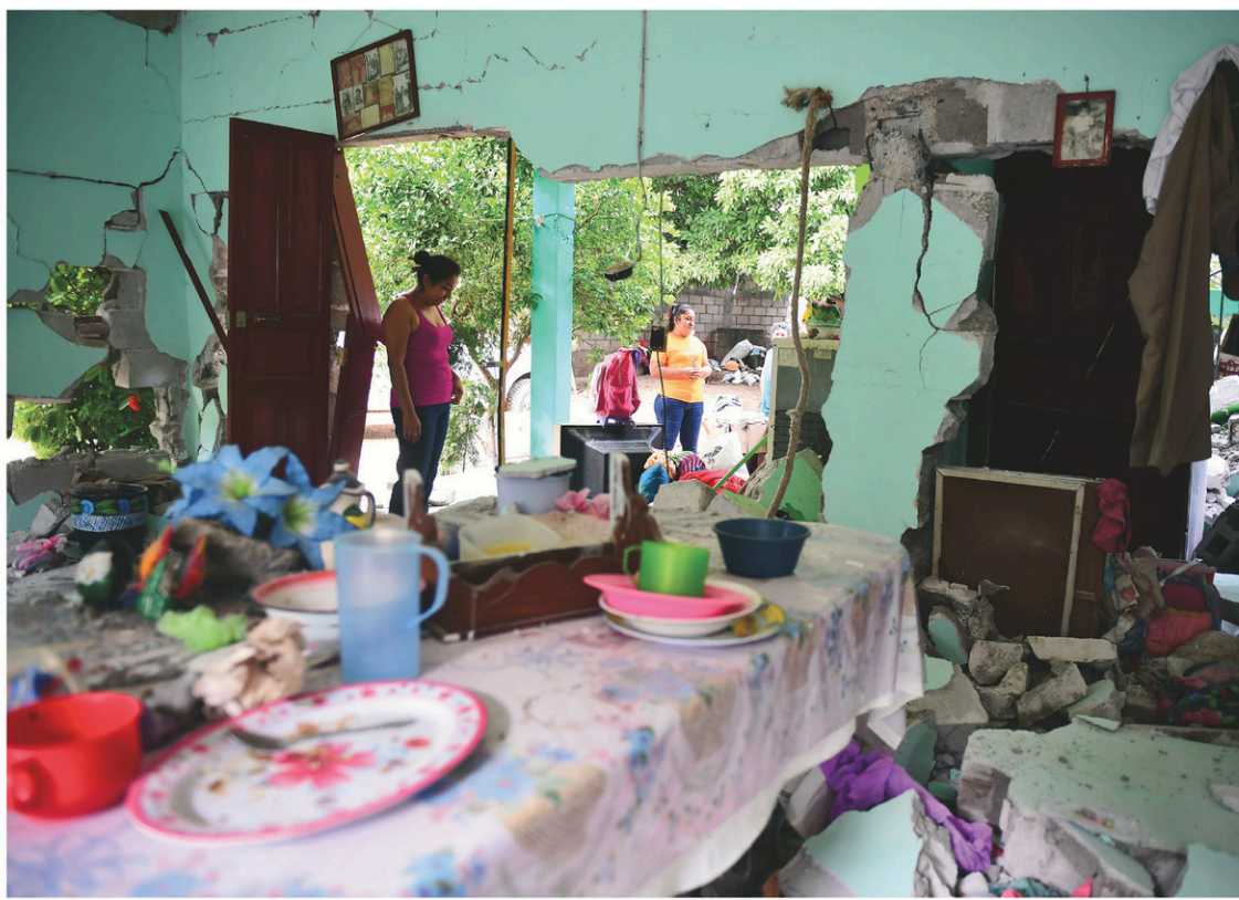
Une maison endommagée après le séisme qui a violemment frappé la ville de Juchitan de Zaragoza