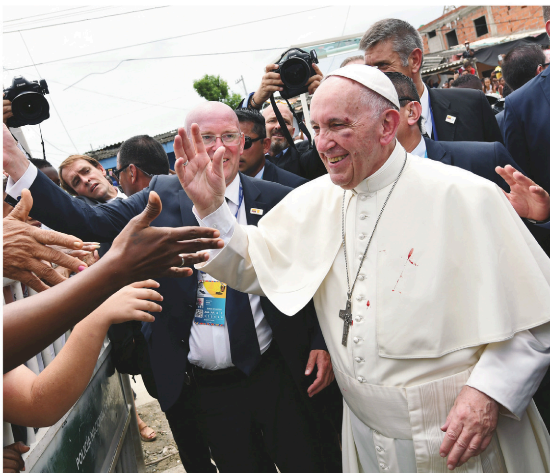
Le pape François était dans la ville portuaire de Carthagène des Indes, dimanche.

Collé à la piste du moderne aéroport international, San Francisco est une illustration du fossé social qui divise Carthagène, où le taux de