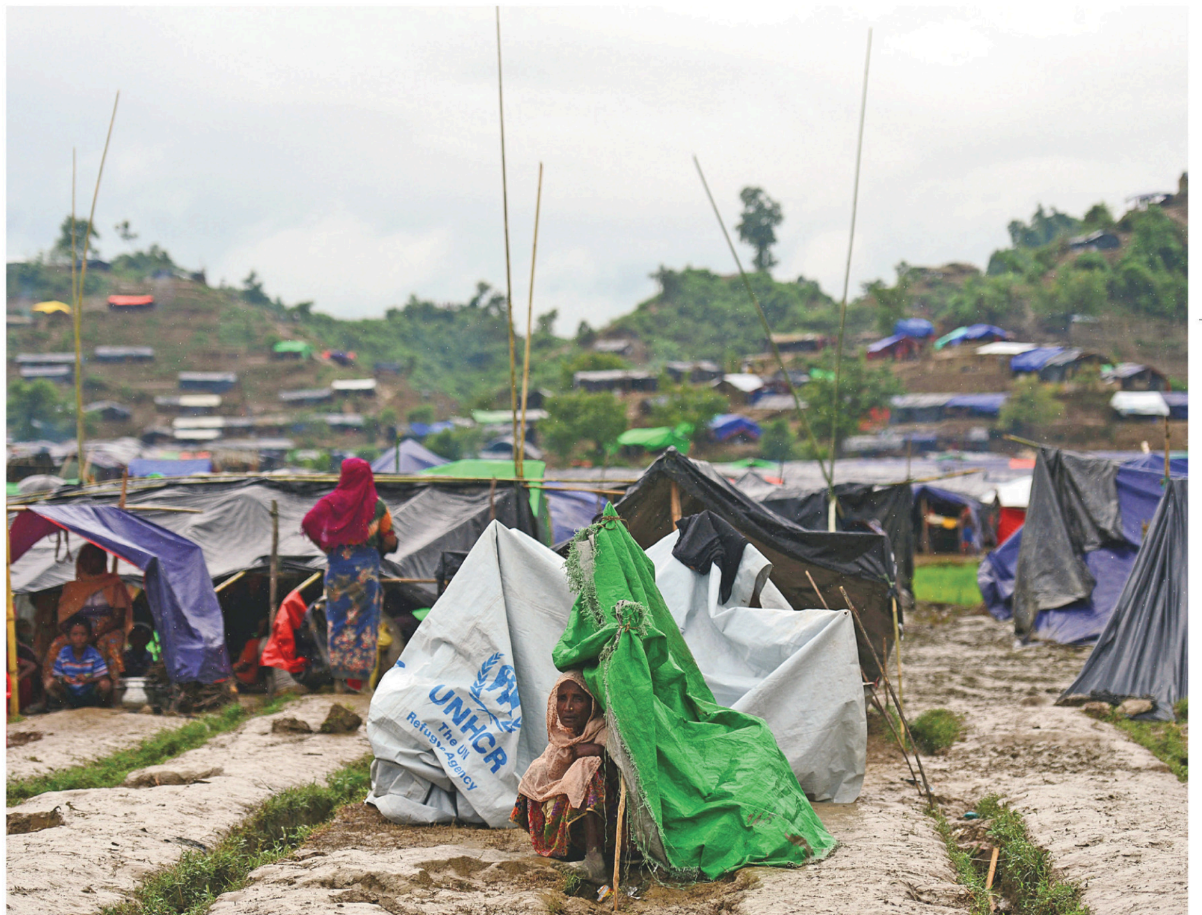
Une réfugiée rohingya est assise près d'un abri temporaire de l'ONU dans un camp près de la ville de Ukhia, au Bangladesh, le 9 septembre 2017.