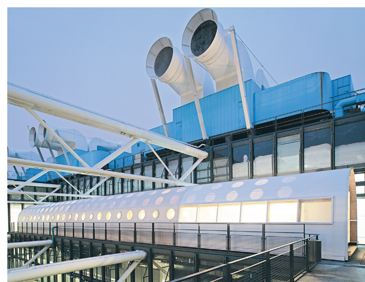
DIDIER BOY DE LA TOUR