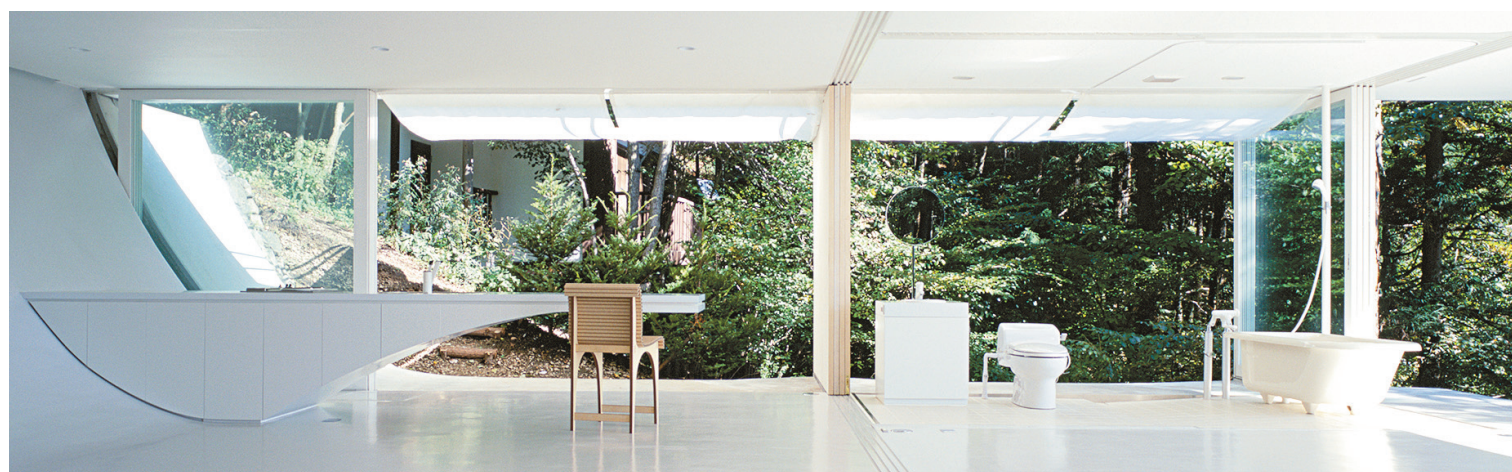
La maison sans murs, 1997, Nagano, Japon.

De 1995 à 1999, Shigeru Ban devient architecte conseiller auprès du Haut Comité aux réfugiés de l'ONU. En Turquie, en Haïti, au Rwanda ou en Nouvelle-Zélande, où il a achevé en