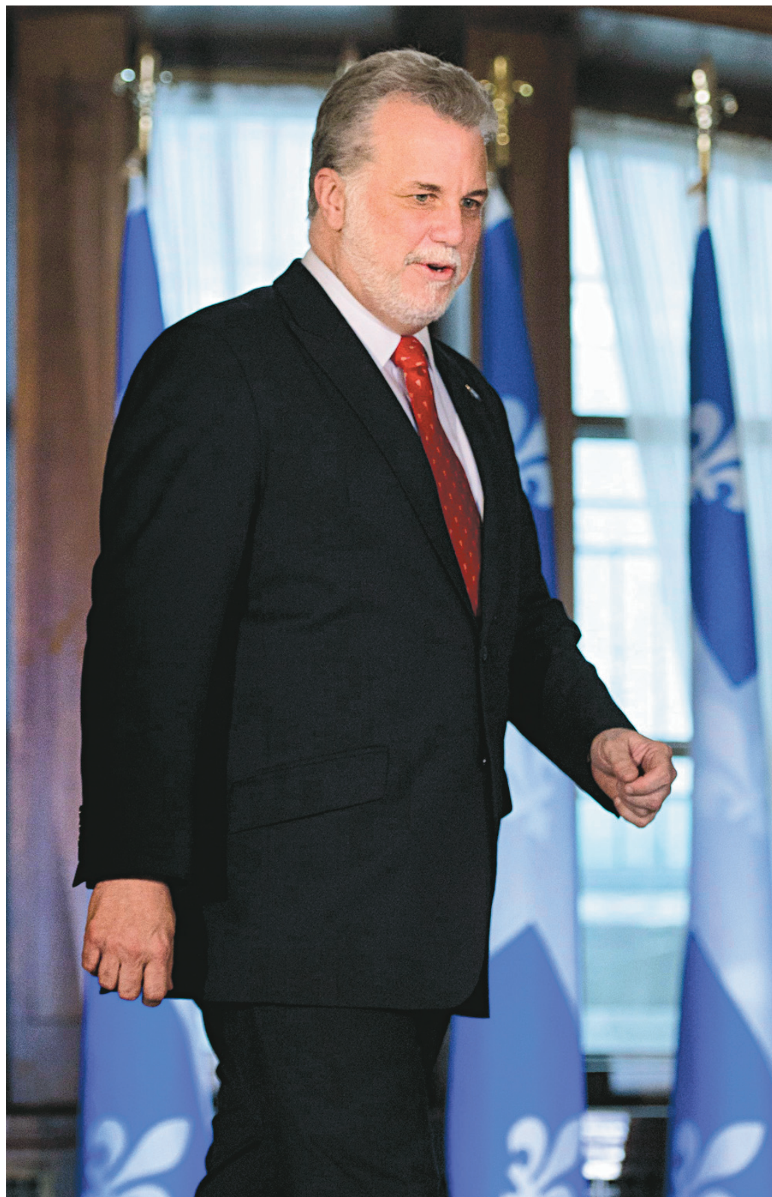
JACQUES BOISSINOT LA PRESSE CANADIENNE

Il faut aussi souligner que le Québec, en ra-