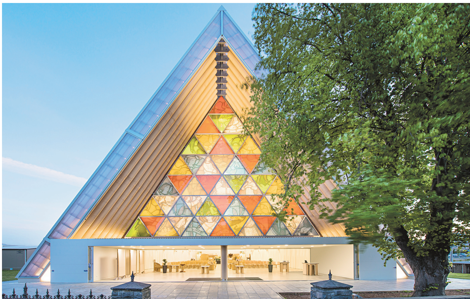
La cathédrale de Christchurch, 2013, Nouvelle-Zélande. À la suite du tremblement de terre de 2011 qui a dévasté la ville, Shigeru Ban a construit un bâtiment en tubes de carton recyclé (PTS, paper tube structure ) destiné à remplacer la cathédrale néogothique détruite lors du séisme. Ci-dessous : Shigeru Ban (à droite) et la fabrication d'un abri d'urgence à Port-au-Prince, en Haïti, en 2010.

« Mes œuvres naissent naturellement de la résolution d'un problème, de la confrontation à une condition particulière ou de l'évolution d'une technologie. Il ne s'agit pas juste de produire une forme. »