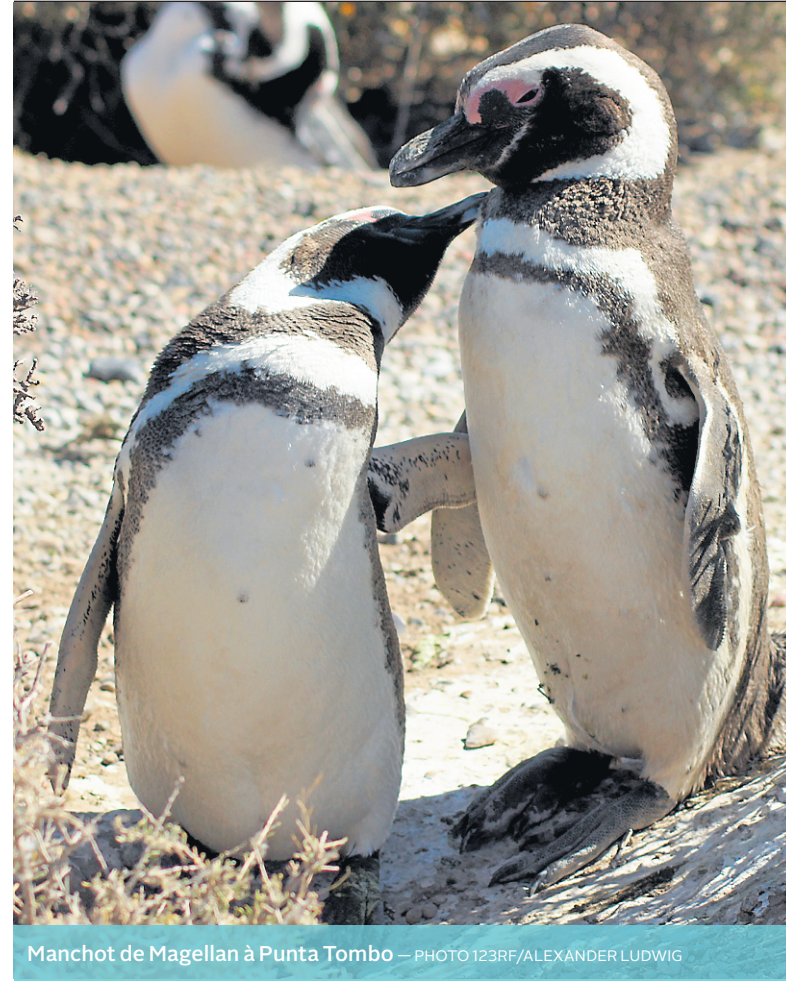
Manchot de Magellan à Punta Tombo