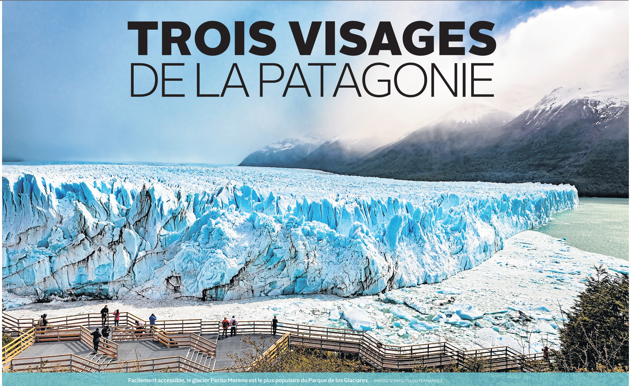
Facilement accessible, le glacier Perito Moreno est le plus populaire du Parque de los Glaciares.