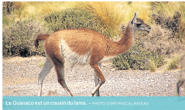
Le Guanaco est un cousin du lama.