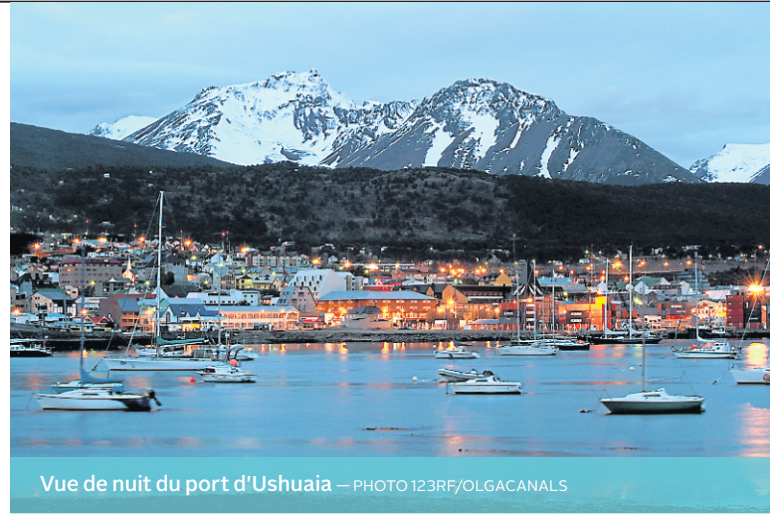
Vue de nuit du port d'Ushuaia