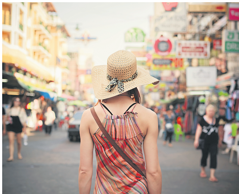
Jeune femme marchant dans la célèbre rue des routards de Khao San à Bangkok, Thaïlande.