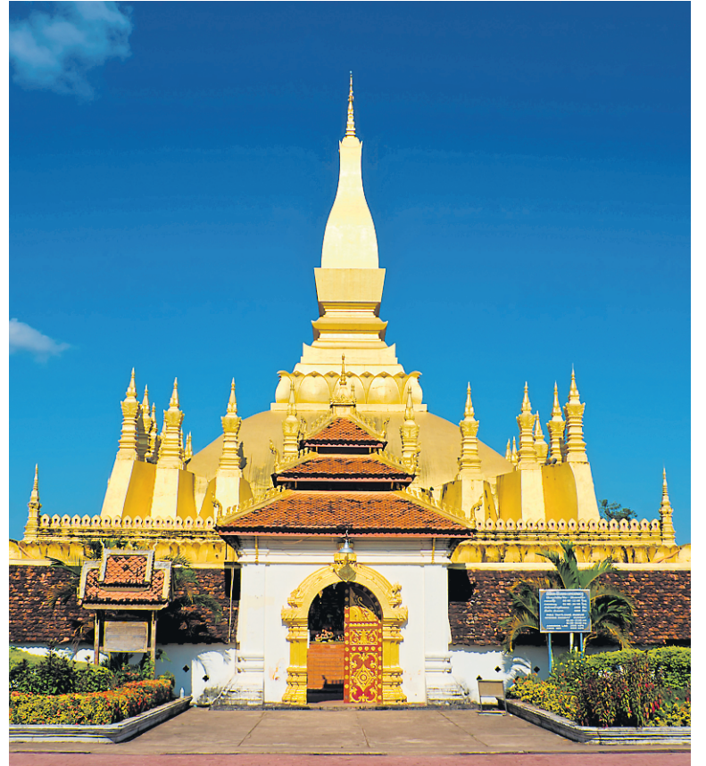
Pha That Luang Stupa à Vientiane, le monument national le plus important du Laos