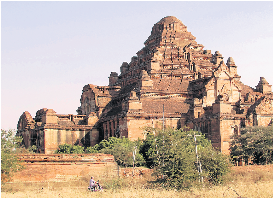
Pour circuler autour des temples de Bagan, il arrive qu'on se permette de sortir des sentiers battus avec une motocyclette électrique.

Suivez mes aventures au www.jonathancusteau.com .