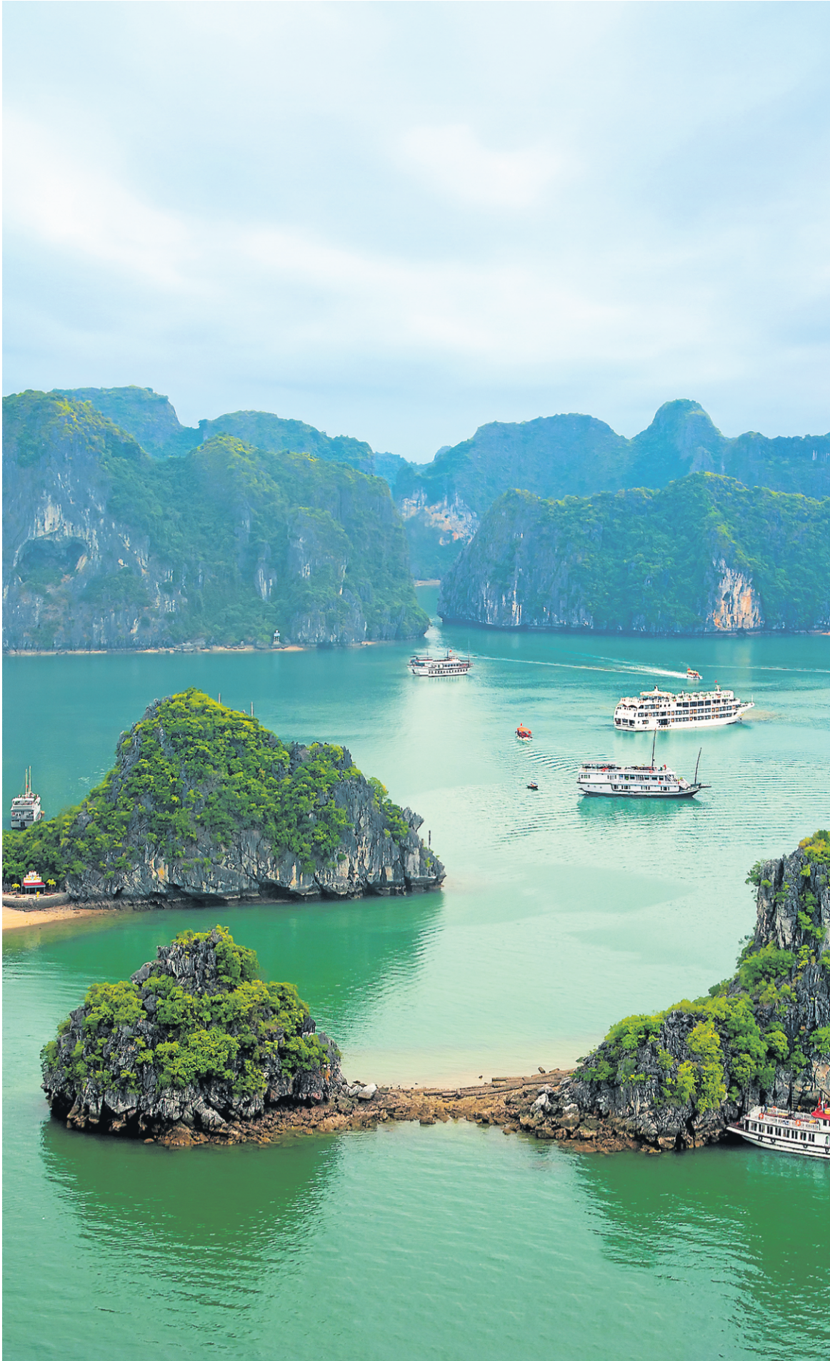
Jonques touristiques flottantes parmi les rochers calcaires au petit matin dans la baie d'Halong, dans la mer de Chine du Sud, au Vietnam, en Asie du Sud-Est.