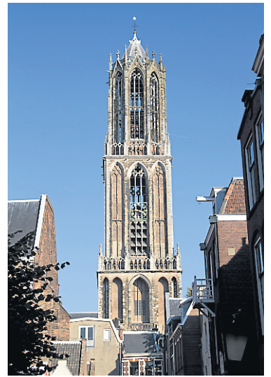
Tour de la cathédrale Dom d'Utrecht

R Le Wilhelmina Park. L'été, familles et groupes d'amis viennent se prélasser sur la pelouse, y