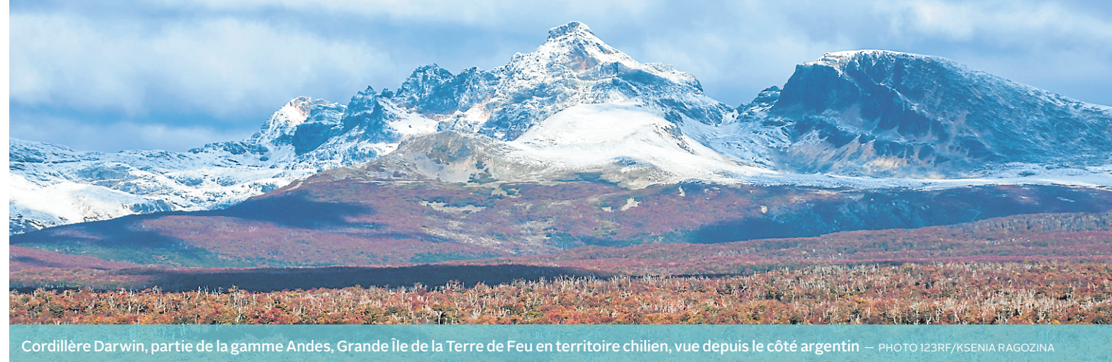
Cordillère Darwin, partie de la gamme Andes, Grande île de la Terre de Feu en territoire chilien, vue depuis le côté argentin