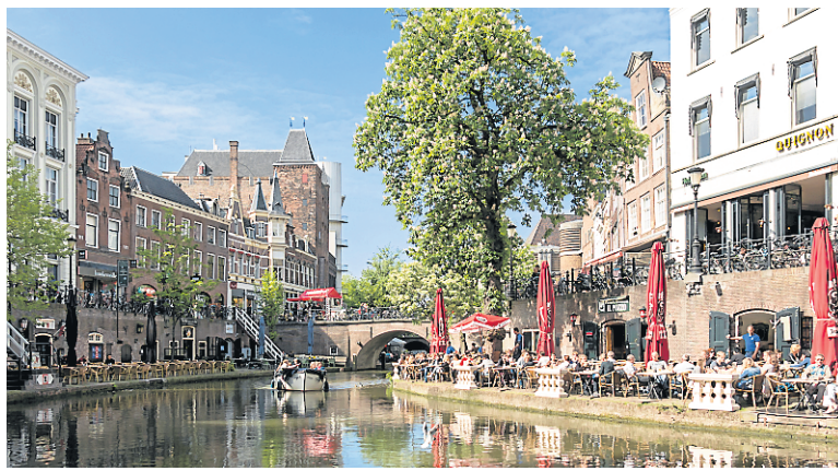
Château Oudaen et terrasses de restaurants du côté du canal Oudegracht dans la ville d'Utrecht aux Pays-Bas