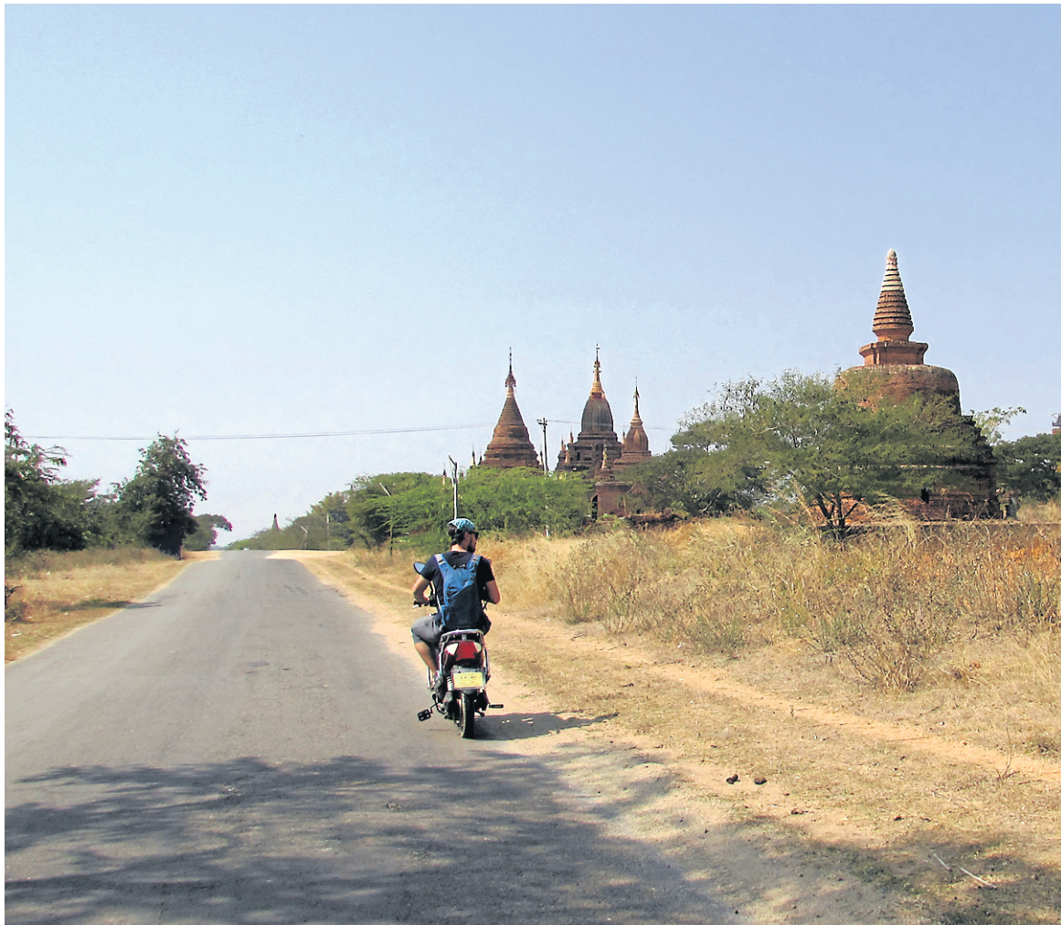
Les plus conservateurs, ou les moins habiles comme moi, tenteront de circuler sur les routes pavées...