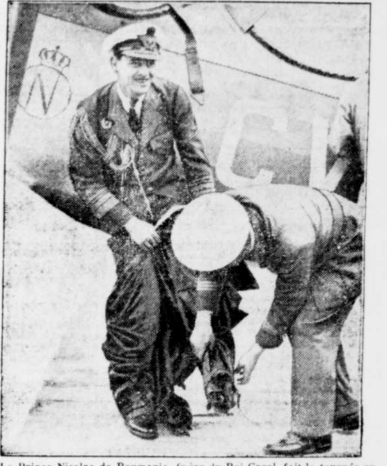
Le Prince Nicolas de Roumanie, frère du Roi Carol, fait la tournée en avion des capitales de l'Europe. Il veut se rendre en Amérique en survolant l'Atlantique, mais son royal frère s'y oppose énergiquement.