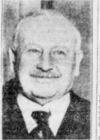
Le vicomte BURNHAM, fameux journaliste anglais et ancien éditeur du "Daily Telegraph" de Londres qui vient de mourir à l'âge de 71 ans, après une carrière des plus distinguées.