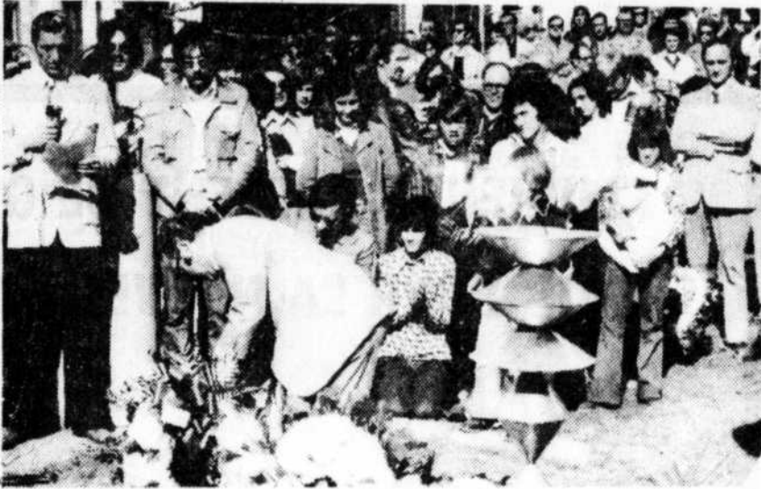
Des centaines de travailleurs de Thetford Mines étaient présents, le 1er mai, au dévoilement d'un monument érigé à la mémoire de leurs confrères qui, depuis un siècle, ont laissé leur vie dans les mines d'amiante. Une minute de silence a été observée, une flamme-souvenir a été allumée et des gerbes de fleurs déposées au pied du monument.