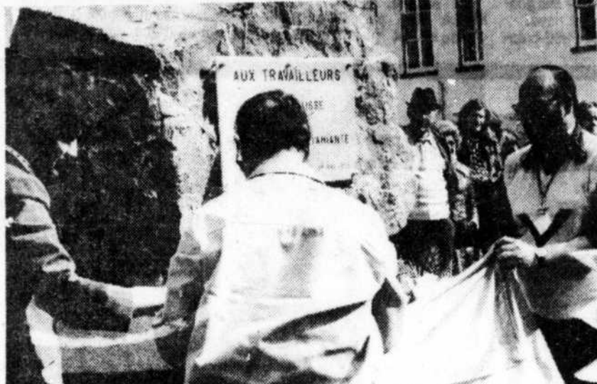
Des centaines de travailleurs de Thetford Mines étaient présents, le 1er mai, au dévoilement d'un monument érigé à la mémoire de leurs confrères qui, depuis un siècle, ont laissé leur vie dans les mines d'amiante. Une minute de silence a été observée, une flamme-souvenir a été allumée et des gerbes de fleurs déposées au pied du monument.