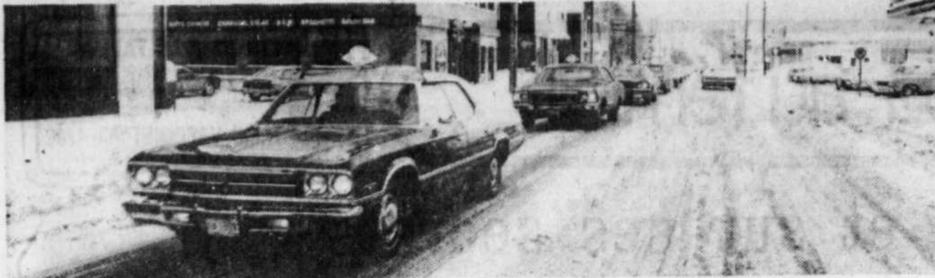
Les 46 propriétaires de taxis, au volant de leur véhicule respectif, ont défilé en ville hier pour faire connaître le regroupement de leurs effectifs en un seul