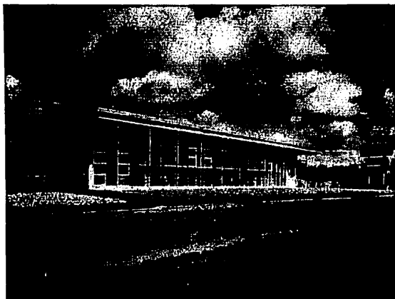
11401 Boulevard Pie IX, Montréal Nord

Lorsqu'il s'agit de réparer, d'embellir, d'améliorer votre maison... venez en toute confiance chez