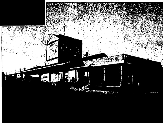
12200 Boulevard Reed — Cartierville

LE CHOIX LE PLUS COMPLET DE MATERIAUX ET QUINCAILLERIE DE CONSTRUCTION A MONTREAL