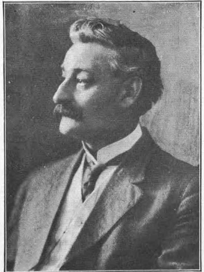
M. Médéric Martin, maire de Montréal

M. Médéric Martin, le Maire de Montréal, veut que le peuple de la métropole ait plus de musique dans ses parcs et squares durant l'été. Il vient de faire doubler l'octroi destiné aux musiques militaires, en le faisant porter de $1,500 à $3,000.