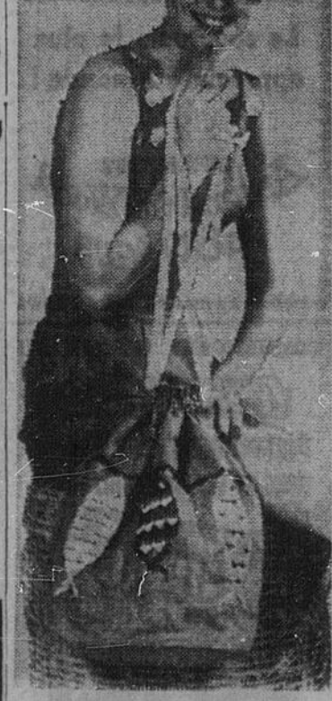
PETITS POISSONS... PETITS POISSONS... comme vous rendez ces accessoires attrayants... et quel plaisir pour vous, Madame, de vous promener à la plage avec ce ravissant chapeau de soleil et ce sac original en coton denim avec garniture en ruban de plastique de couleur.