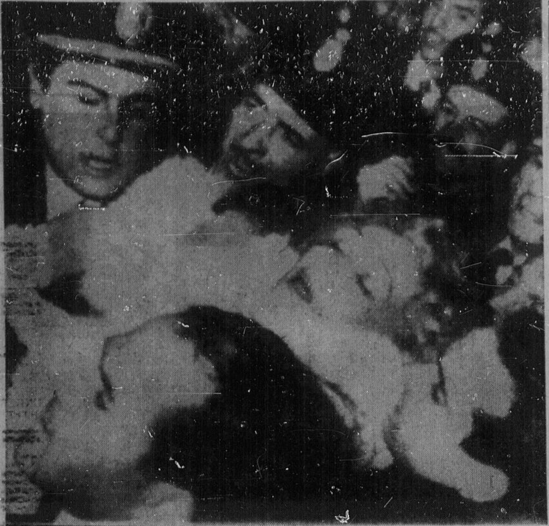
LA BELLE MARLENE S'AFFAÏSSE — L'admiration de milliers d'Argentins a trop taxé la belle MARLENE DIETRICH qui s'est affairée au milieu de la foule qui l'acclamait au théâtre de l'Opera de Buenos Aires où elle devait paraître brièvement à la scène. L'étoi-