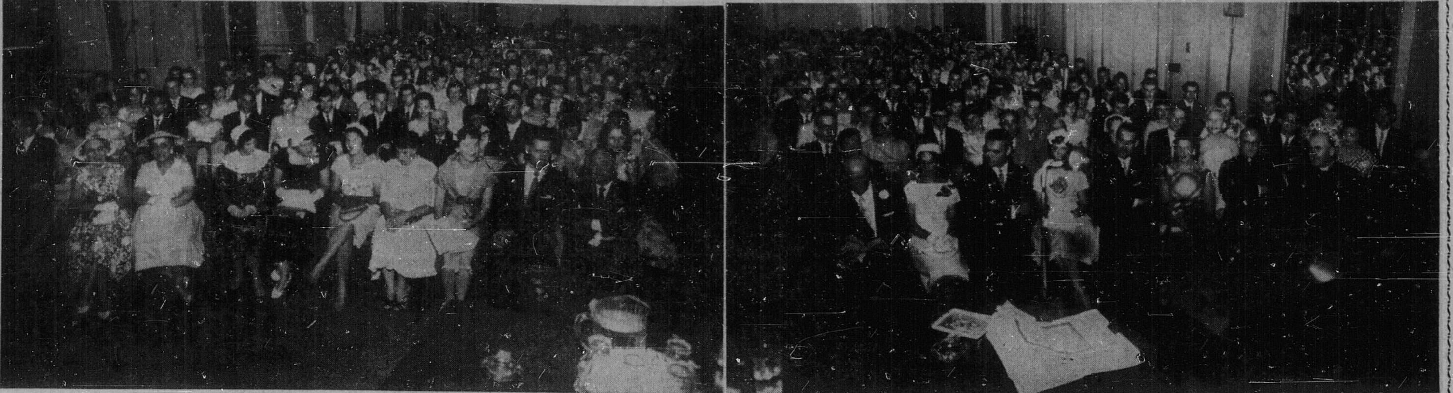
Au Château Laurier le 29 juin dernier, le Collège Commercial Bilingue Larocque reçut de nombreux témoignages d'appréciation pour les succès remportés en 1959