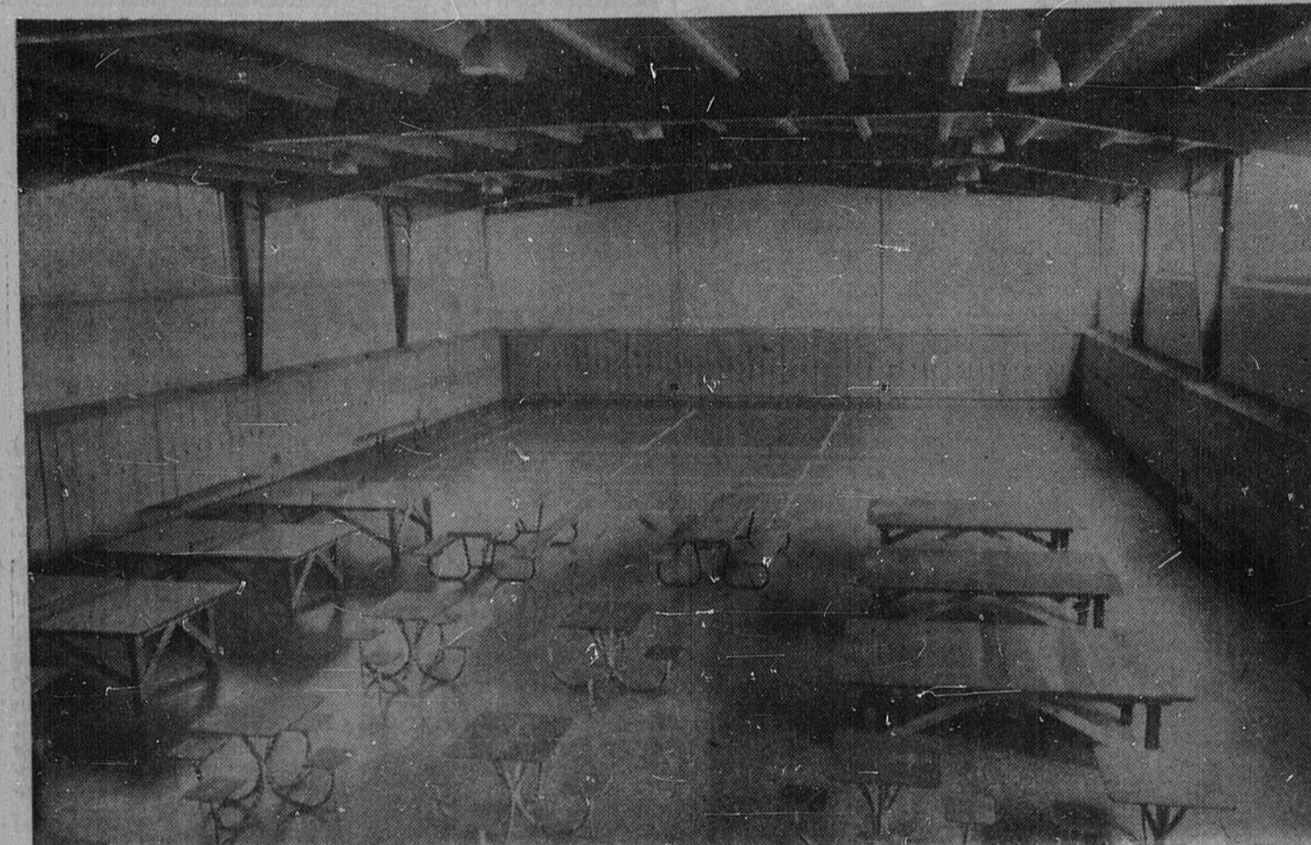
LA SALLE DE RECREATION — Une partie de l'immense gymnase du Petit séminaire sert de salle de récréation et de salle académique à l'occasion. On y voit ici les tables de ping-pong et autres tables où les élèves peuvent jouer aux