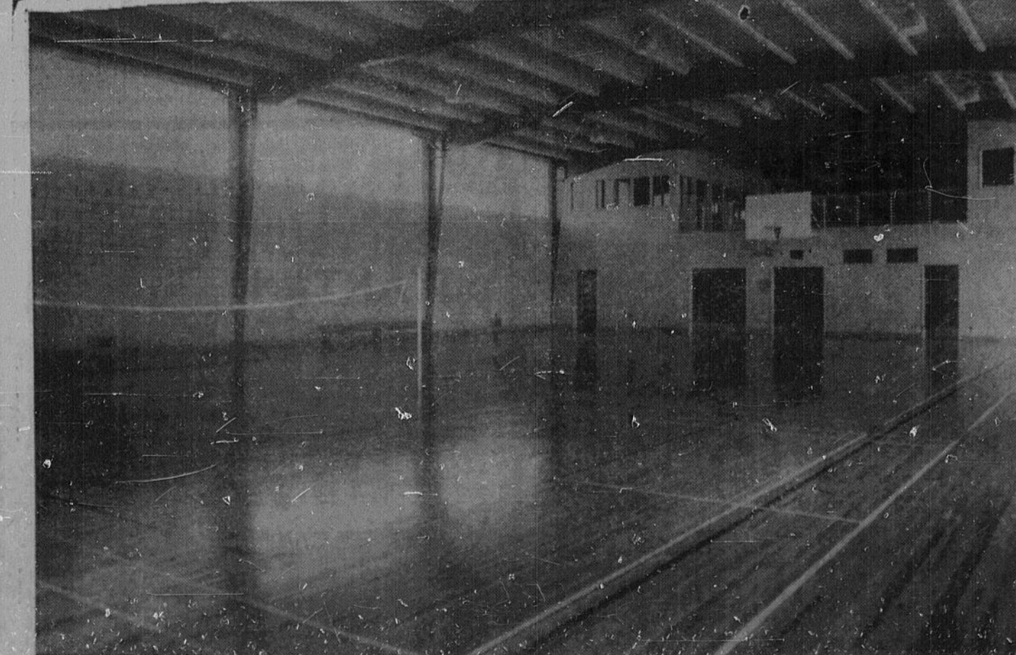
LE GYMNASE — Voici le magnifique gymnase du Petit séminaire. C'est un des plus beaux de la région. Le plancher, du dernier perfectionnement, se prête magnifiquement au ballon-pancier. On y joue également au badminton comme le fait foi le filet tendu ici. Au fond, c'est la séparation entre le gymnase même et la salle de récréation où l'on monte quel-