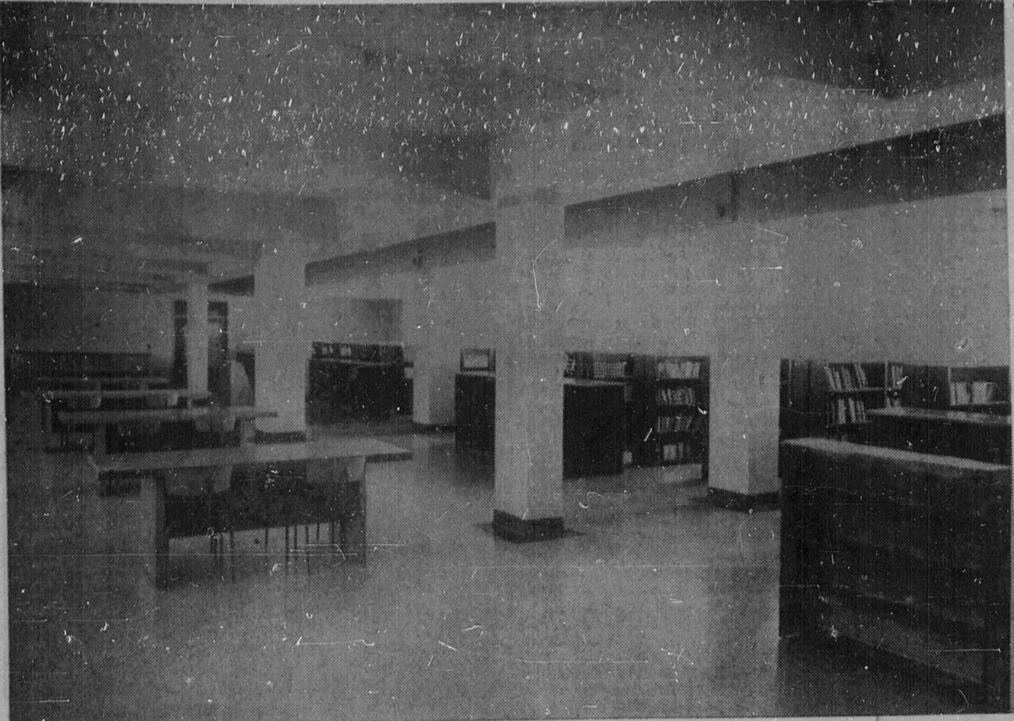
LA BIBLIOTHEQUE — Une innovation au Petit séminaire cette année est l'aménagement de cette bibliothèque centrale au sous-sol de l'édifice qui contient les salles d'étude. On y a réuni les volumes qui prenaient place ordinairement