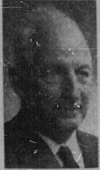
Par François-J. LEDUC