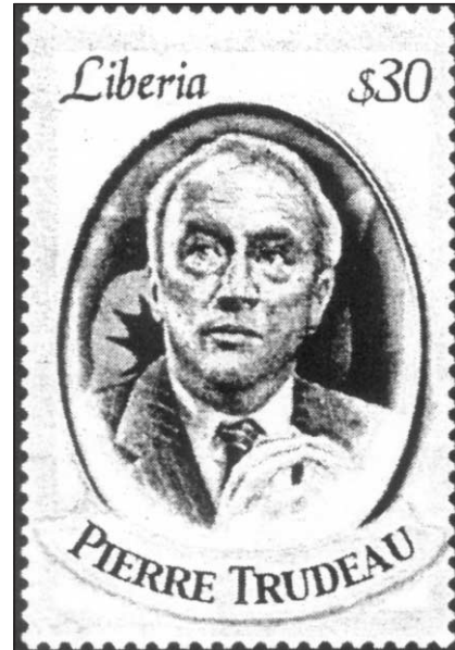
Timbre du Liberia à l'effigie de Pierre E. Trudeau.

La Poste canadienne qui a émis des feuillets de 16 timbres en hommage à l'ex-premier ministre Pierre Trudeau, en plus d'un bloc-feuille de quatre timbres, le 1 er juillet, a