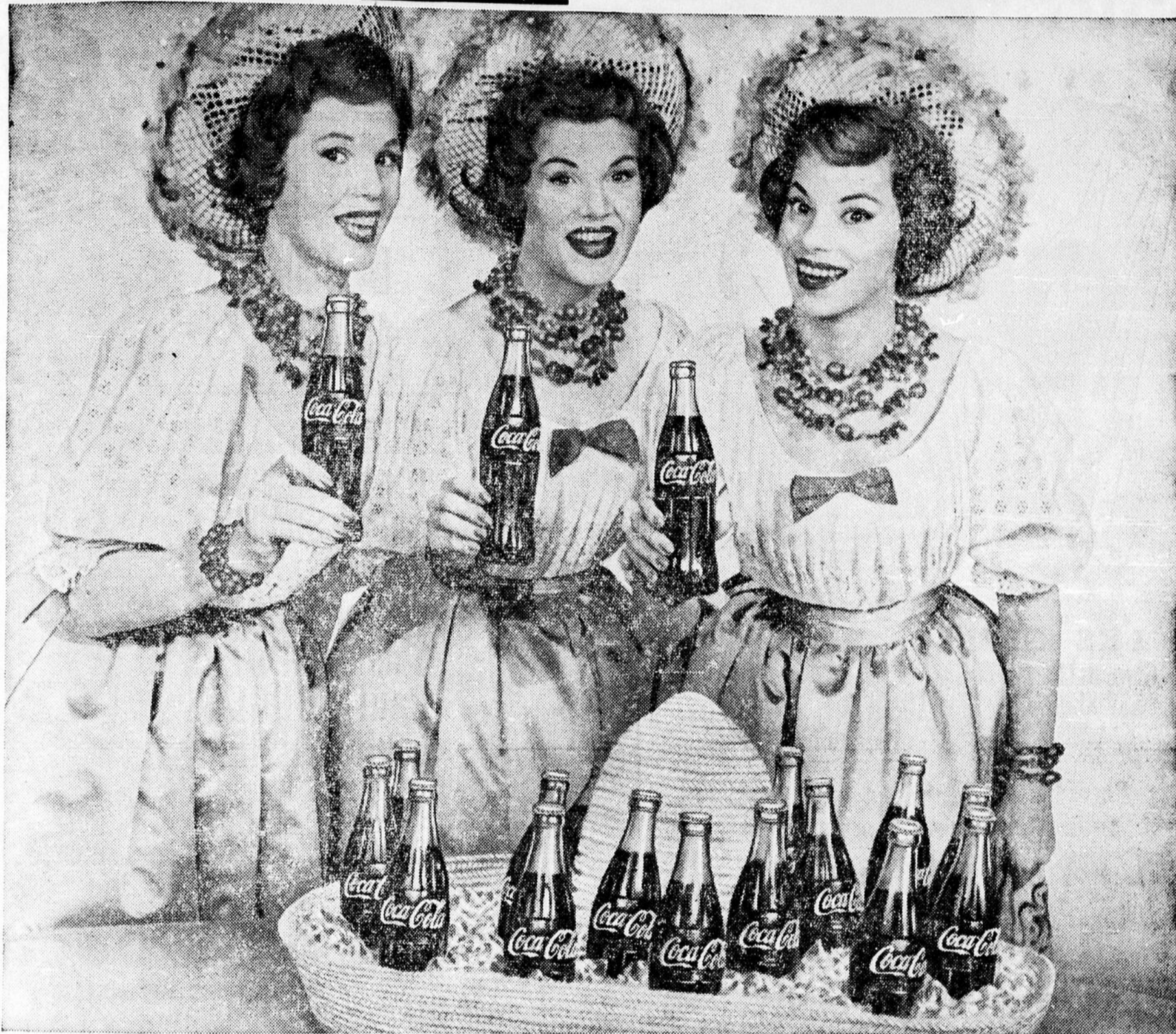
DITES "COKE" OU "COCA-COLA" — LES DEUX MARQUES IDENTIFIENT LE PRODUIT DE COCA-COLA LTÉE — LE BREUVAGE PÉTILLANT PRÉFÉRÉ DANS LE MONDE ENTIER.