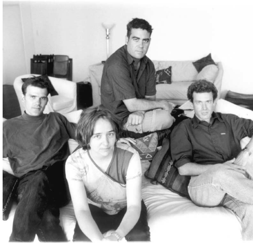
Les quatre saxophonistes de Quasar.

« Nous avons de grandes ambitions », lâche-t-elle sans ambages. Féru de musique écrite, la saxo-