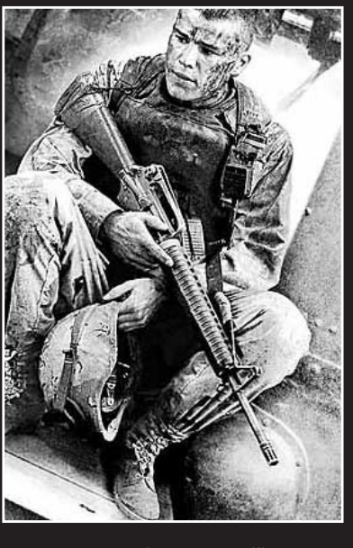
Le producteur JERRY BRUCKHEIMER ORIENTE LE HÉROÏQUE SCOTT