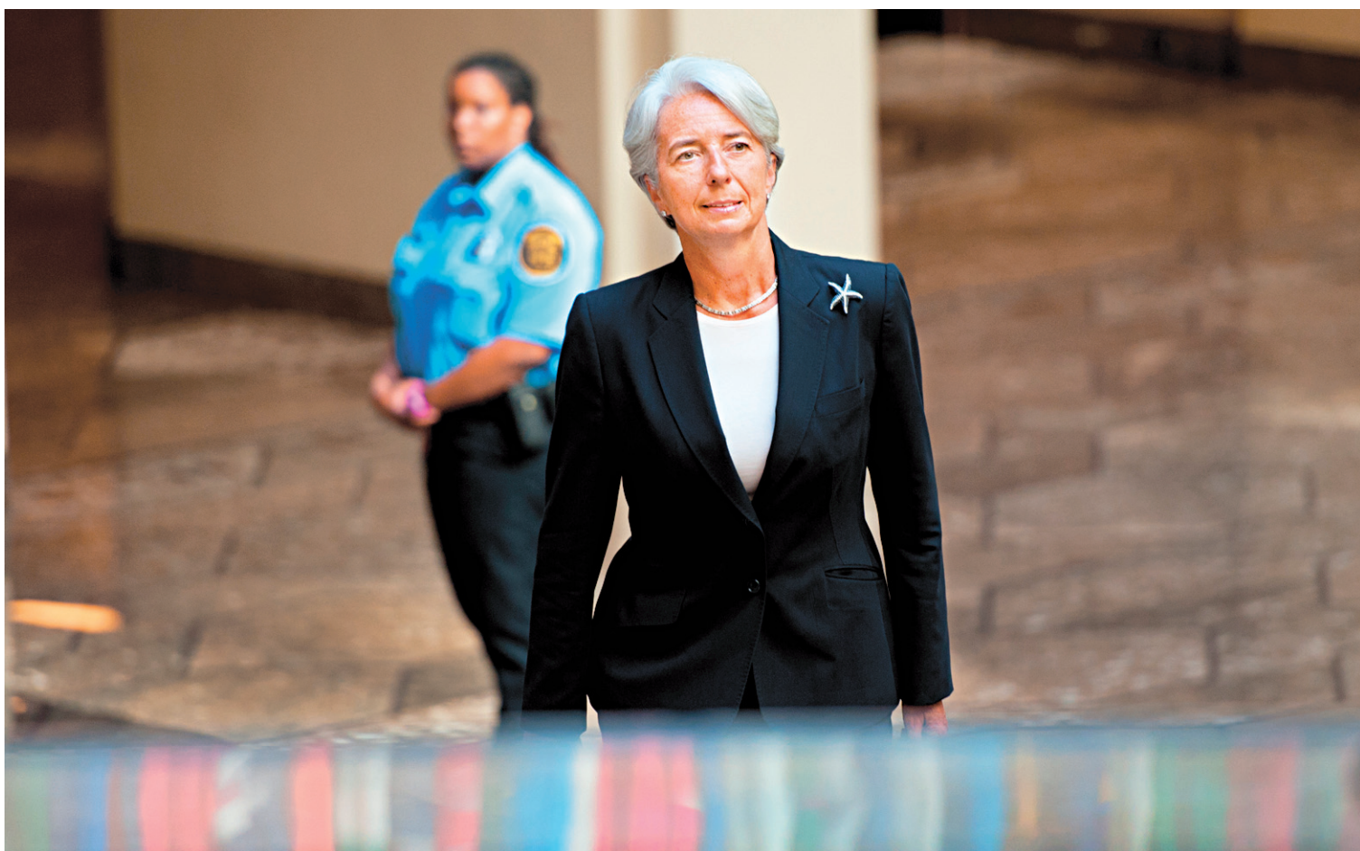
Christine Lagarde à son arrivée dans son nouveau lieu de travail, le FMI, à Washington.