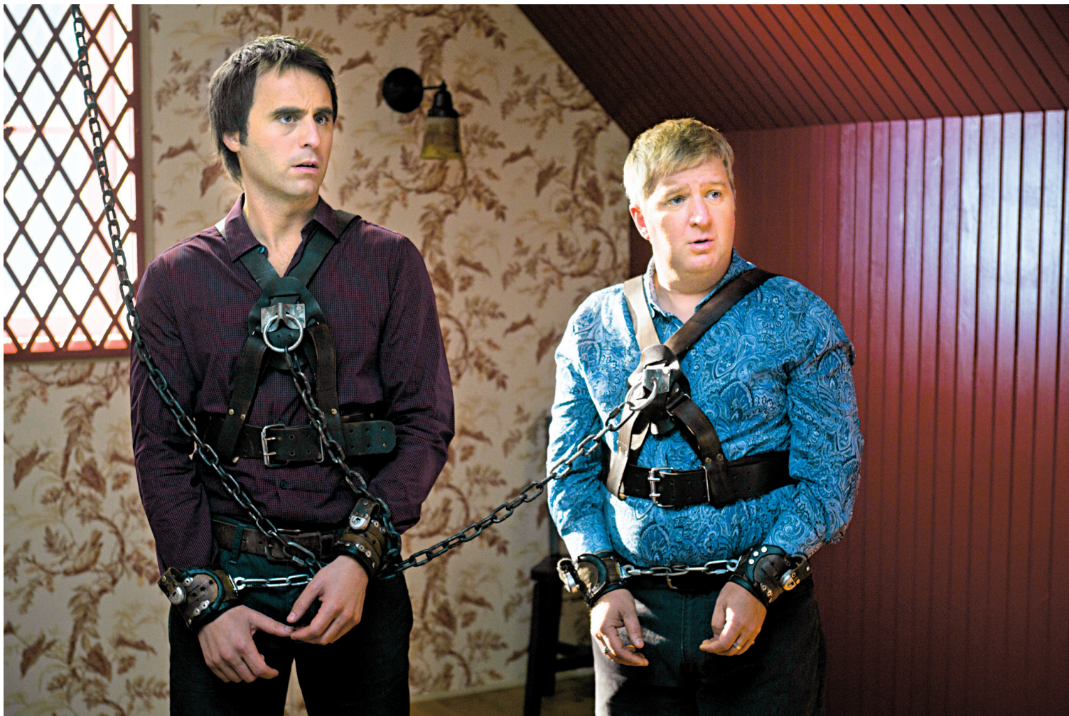
Les deux comiques mal pris sont joués par Louis-José Houde et Benoît Brière.