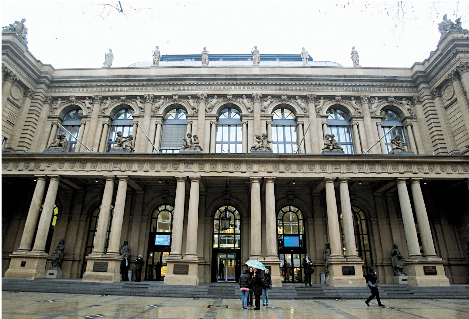
Vue de l'extérieur de Deutsche Börse