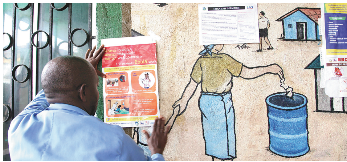
Un infirmier épingle des informations au sujet d'Ebola sur un mur public à Monrovia, au Liberia.

Des policiers en civil interrogeaient les rares passants sur leur destination et les ren-