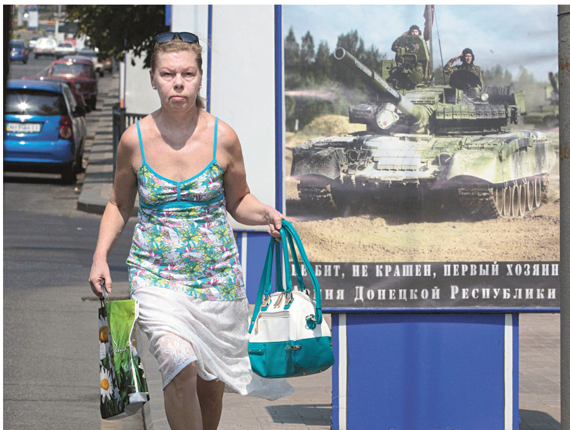
Cette femme marche devant une affiche de recrutement des forces rebelles à Donetsk.

Donetsk et Lougansk « sont les villes clés occupées par les terroristes aujourd'hui, celles où se trouvent la plupart des terroristes et des armes, et nous savons qu'il ne sera pas facile de les libérer », a déclaré