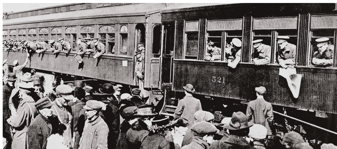
Le 22 e bataillon, premier bataillon canadien-français, part de Saint-Jean de Terre-Neuve en 1915. Après quelques semaines d'entraînement en Grande-Bretagne, les troupes iront combattre en France.

D Lire aussi : Un éditorial d'Henri Bourassa publié le 5 juin 1916, ainsi qu'une chronologie canadienne de la guerre. Sur LeDevoir.com