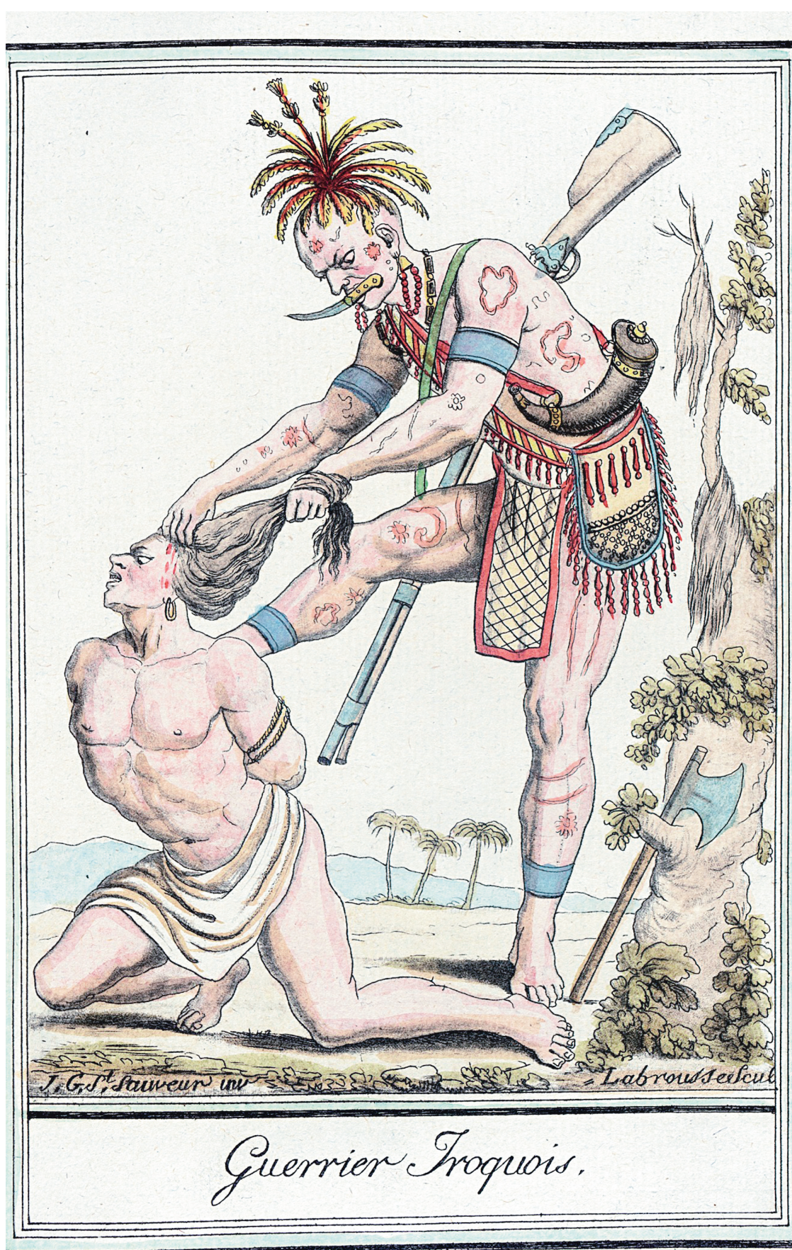
Guerrier iroquois dessiné par Jacques Grasset de Saint-Sauveur au XVIII e siècle. La scalpation a profondément marqué l'imaginaire du Nouveau Monde.

Sur les cartes d'époque, comme celle de Jean Guérard en 1634, on inscrit dans le