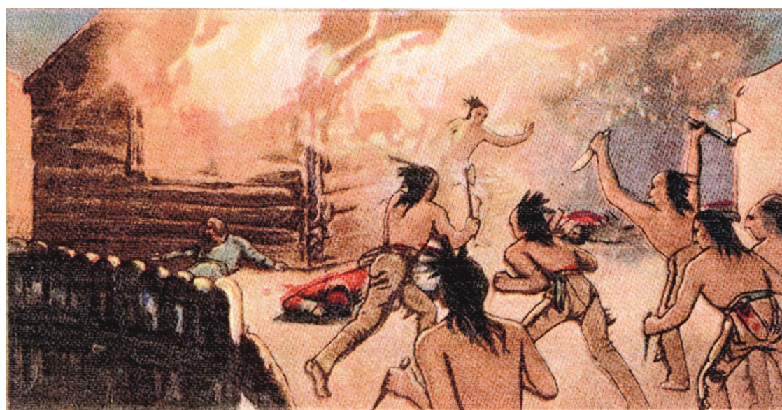
Estampe Massacre et incendie à Lachine, 1689, 1925-1950