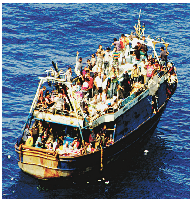
Fin de traversée pour un groupe d'Africains

Selon des chiffres officiels arrêtés au 30 juillet, la marine militaire a effectué dans le cadre de l'opération Mare Nostrum 426 interventions depuis le début de l'année et a secouru plus de 93 000 immigrés.