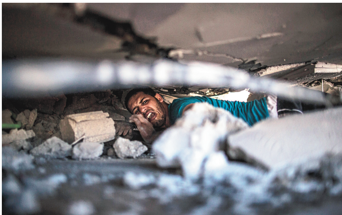
Un Palestinien rampe sous les débris d'une maison détruite par les bombardements de lundi à la recherche de survivants.

Avec Jeanne Corriveau et La Presse canadienne Le Devoir