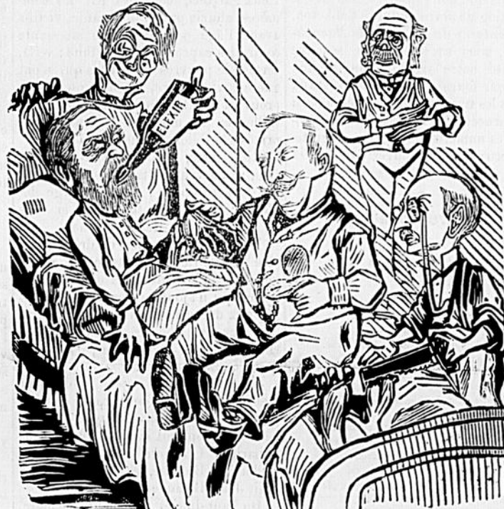
UN MARTYR DE LA SCIENCE.

Depuis bientôt deux mois, le Président des États-Unis se meurt des suites d'une consultation médicale. S'il en revient, c'est qu'il a la vie dure.