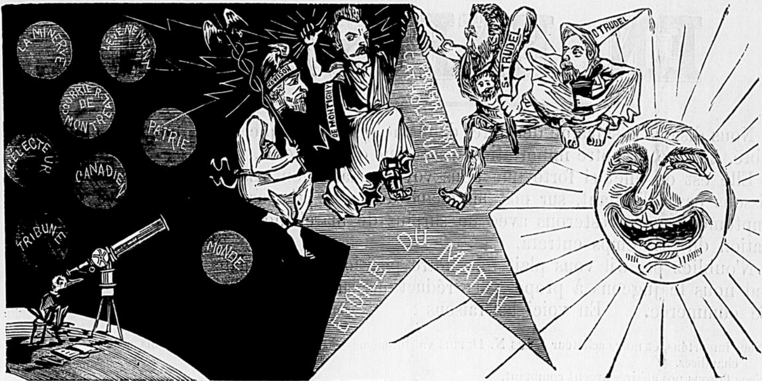
LES MONDES HABITÉS.

Le Canard vient de découvrir, dans la constellation de l'Ecrevisse, une étoile fixe de sixième grandeur: Le nouvel astre doit s'interposer entre le soleil, qui luit pour tout le monde, et les corps plus ou moins opaques qui ornent le firmament du journalisme canadien. Conséquence: éclipse totale pour ces derniers. Cette étoile est habitée par Jupiter Tonnant, Hercule, Hyppocrate et Mercure, les dieux de l'Olympe programmeur.