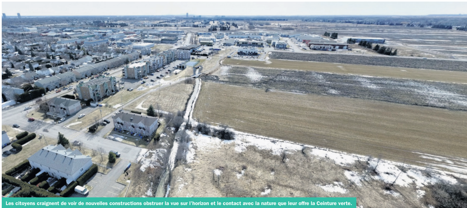
Les citoyens craignent de voir de nouvelles constructions obstruer la vue sur l'horizon et le contact avec la nature que leur offre la Ceinture verte.