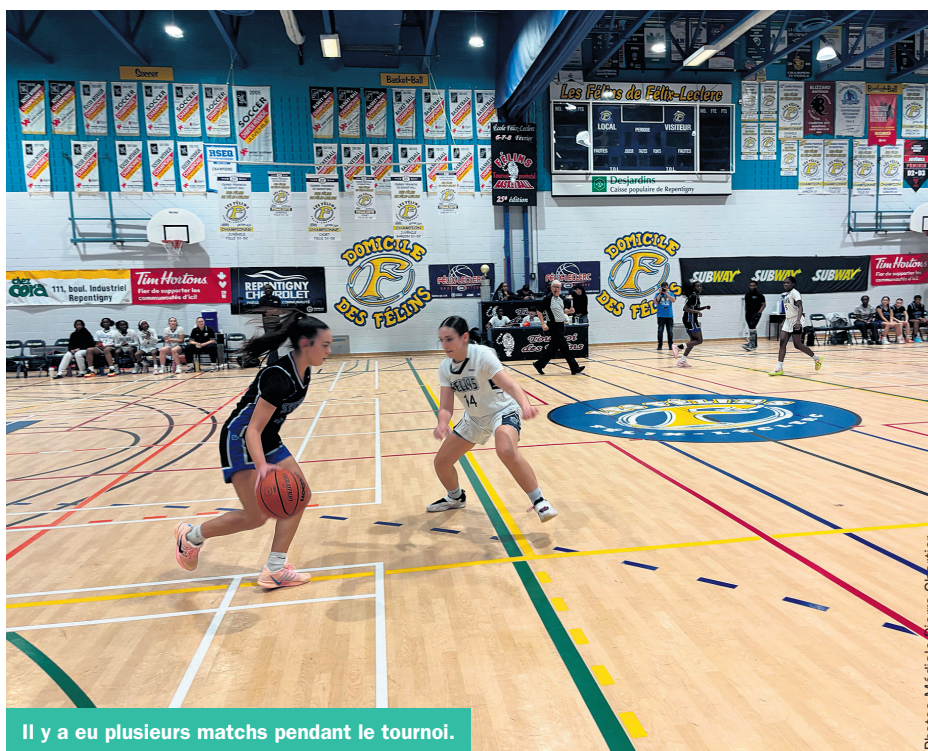
Il y a eu plusieurs matchs pendant le tournoi.

de la tradition, les bénévoles s'occupent de vider les classes et les équipes peuvent s'installer dans une classe. Bien entendu, le service de cafétéria est ouvert afin de dispenser les services de repas aux groupes qui logent à l'école durant le week-end.»