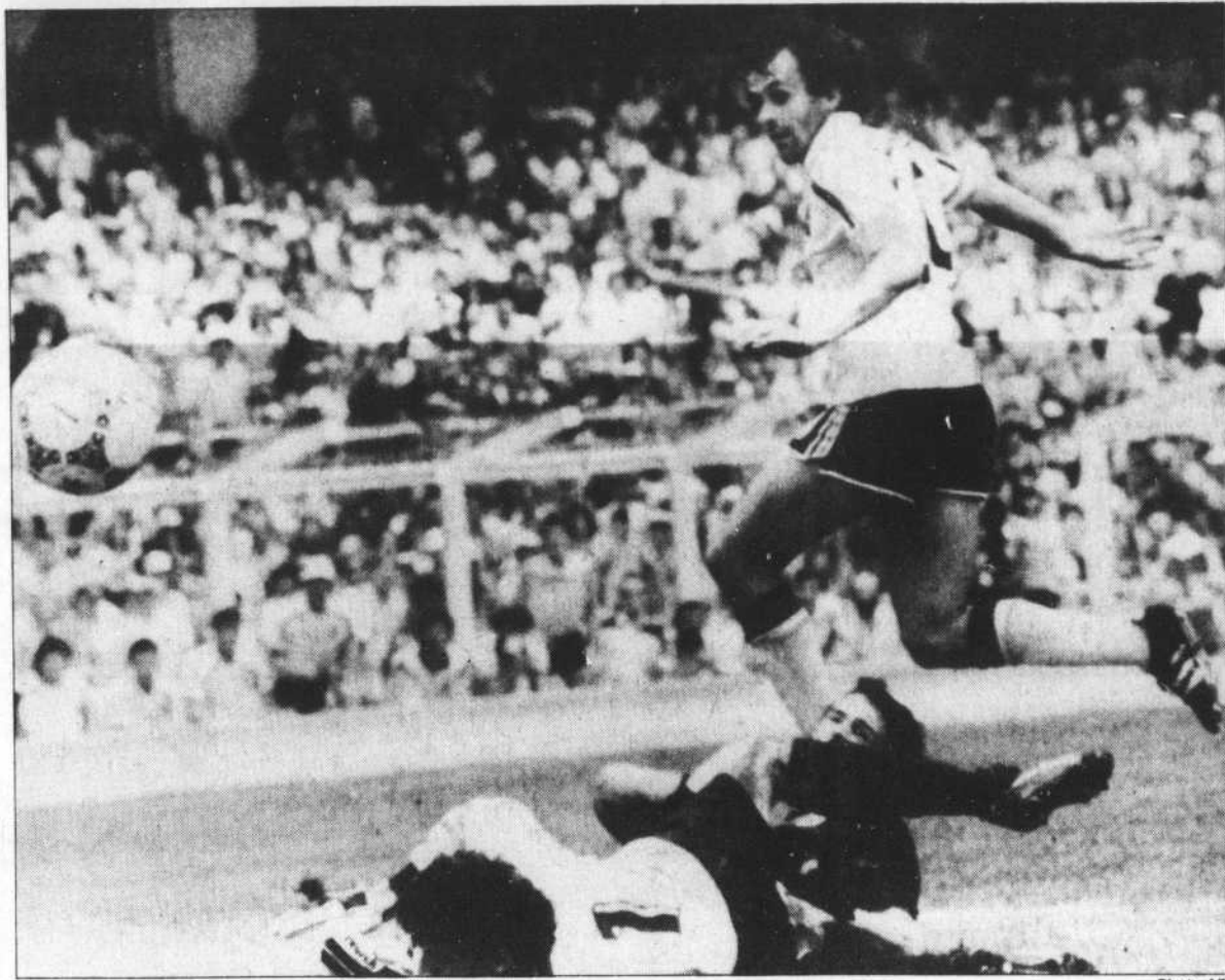
L'as marqueur français, Michel Platini, déjoue la vigilance du gardien italien, Giovanni Galli, pour donner les devants 1-0 aux « Bleus » au cours de la première demie.

Vierchowod devait également stopper une échappée de Giresse au