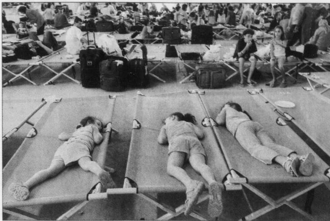
Jeunes réfugiées canadiens se reposant hier à Larnaca (Chypre).

Jusqu'à lundi, le ministère des Affaires étrangères avait offert le