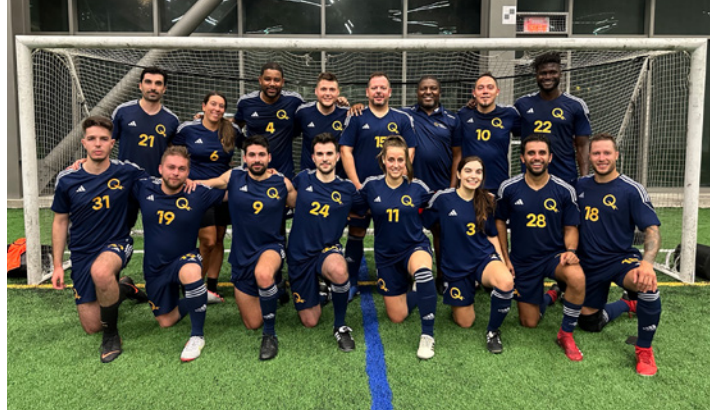
Équipe de soccer 2023 d'Hydro-Québec

L'équipe de soccer de la Coupe Centraide, une collecte de fonds destinée aux entreprises organisée par Centraide du Grand Montréal et la Fondation de l'Impact de Montréal