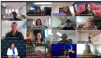
5. Volet virtuel de la soirée