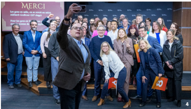
4. Ambassadrices, ambassadeurs, championnes et champions Leaders à l'amphithéâtre du siège social