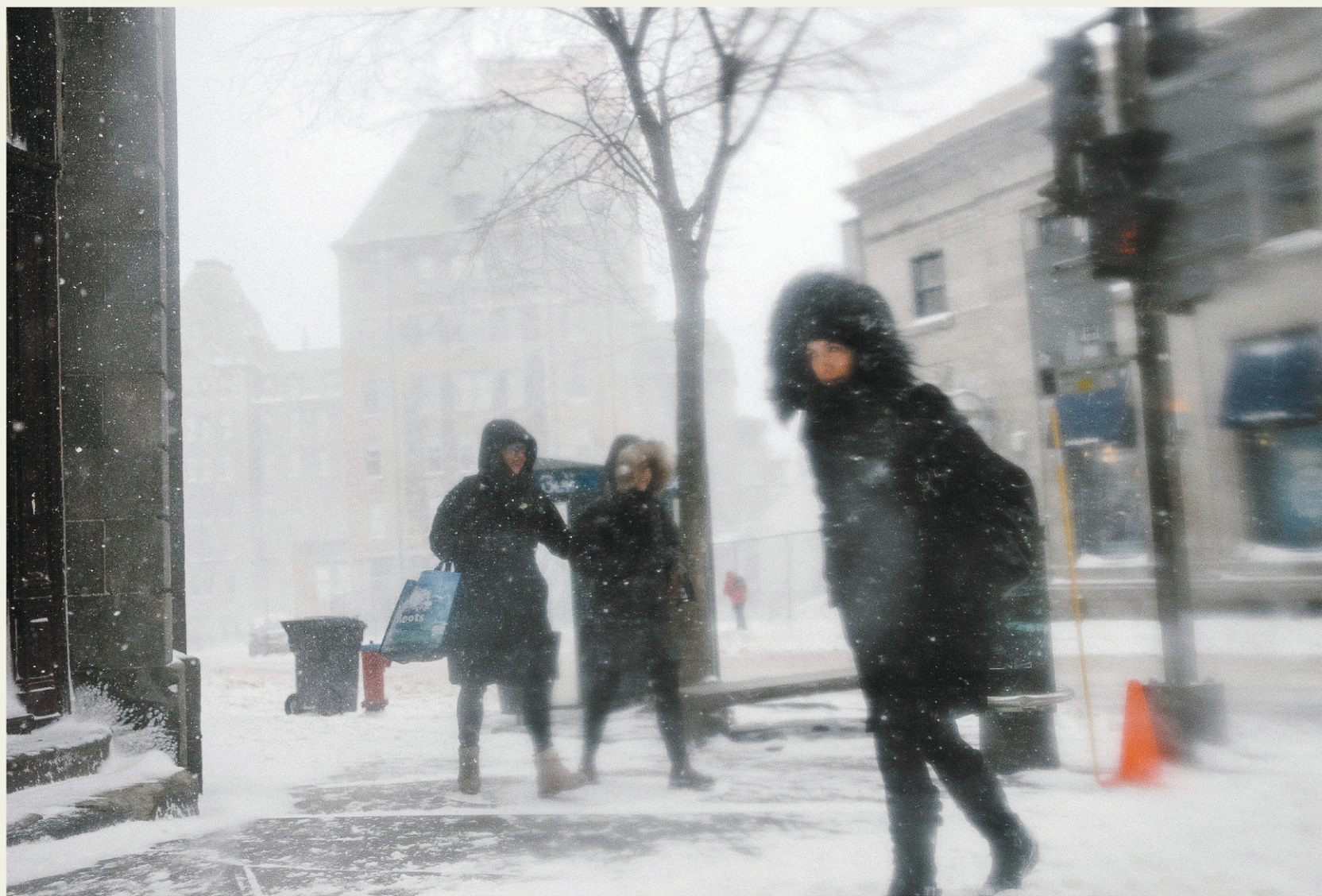
RENAUD PHILIPPE LE DEVOIR

Le printemps a plié bagage mercredi , laissant place aux précipitations de neige et aux vents forts dans plusieurs régions de la province. À Québec, la visibilité était nulle par endroits, forçant la fermeture de certaines portions de routes. Les Montréalais ont, eux, plutôt affronté la pluie et les mares de sloche. Page A 4