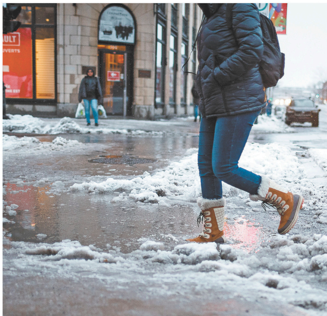
Le point le plus haut de la plupart des rues est situé au centre de la chaussée, alors que les intersections se retrouvent aux points les plus bas, causant l'accumulation de la neige mouillée.

Avec La Presse canadienne et l'Agence France-Presse Le Devoir