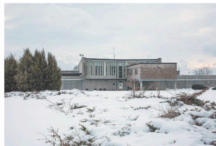
La prison Tanguay a été construite en 1964 sur le terrain de la prison de Bordeaux.