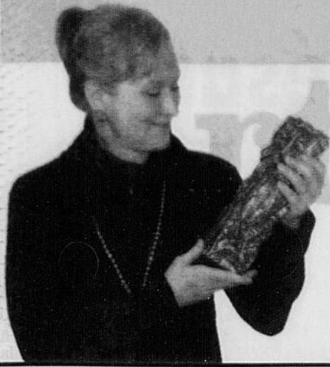
Césars Meryl Streep reçoit un César d'honneur / Page D2