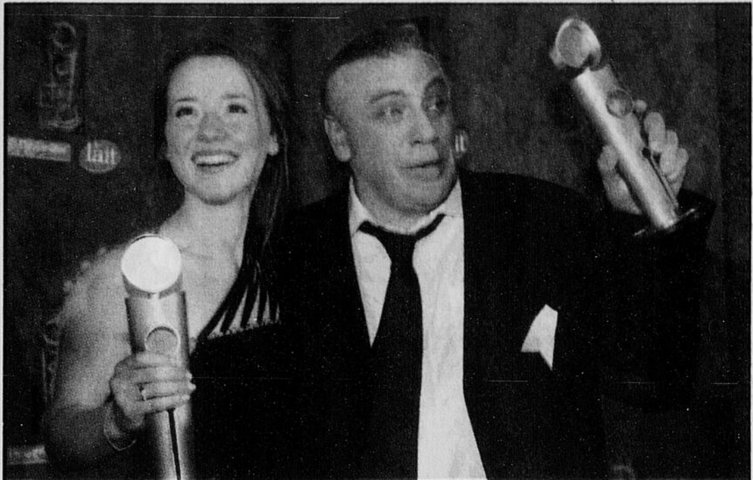
Karine Vanasse et Pierre Lebeau sont repartis avec les Jutra de meilleure actrice et meilleur acteur pour leur interprétation dans Séraphin.