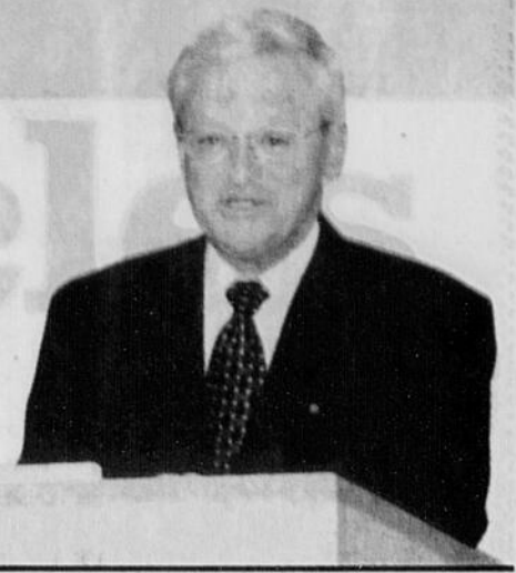
États généraux Non à un régime présidentiel à l'américaine / Page D5