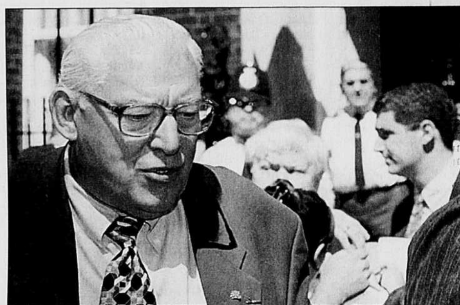
«Les propositions doivent être mises au rebut», a déclaré hier le révérend Ian Paisley, leader du Parti démocratique unioniste.

En fait, les partis unionistes, comme la communauté protestante (pro-Ulster britannique) de la province, sont profondément divisés sur l'attitude à adopter aujourd'hui, et plus généralement sur l'opportunité de se