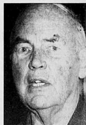
ARCHIVES L'itinéraire de Priebeke: Berlin, Rome, Bariolche, Rome... Berlin?

Le ministre italien de la Justice, Giovanni Maria Flick avait alors aussitôt demandé sa réincarcération, arguant que l'Allemagne avait présenté une demande d'extradition. En octobre 1996, la Cour de cassation avait annulé le premier procès, et décidé qu'Erich Priebeke devait être jugé à nouveau.