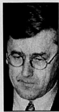
Le juge Richard Therrien

Le Devoir est publié du lundi au samedi par Le Devoir Inc. dont le siège social est situé au 2050, rue de Bleury, 9 e étage, Montréal, (Québec), H3A 3M9. Il est imprimé par Imprimerie Québecor LaSalle, 7743, rue de Bourdeau, division de Imprimeries Québecor Inc., 612, rue Saint-Jacques Ouest, Montréal. L'Agence Presse Canadienne est autorisée à employer et à diffuser les informations publiées dans Le Devoir. Le Devoir est distribué par Messageries Dynamiques, division du Groupe Québecor Inc., 900, boulevard Saint-Martin Ouest, Laval. Envoi de publication — Enregistrement n° 0858. Dépôt légal: Bibliothèque nationale du Québec.