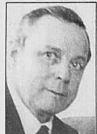
John de Chastelain

Plus d'un an après l'ouverture à Stormont des pourparlers de paix sur l'Ulster, les participants se retrouvent de nouveau autour d'une même table. Ils doivent discuter d'un plan anglo-irlandais sur les institutions futures de l'Ulster. Elles prévoient notamment la création d'organismes «transfrontières» et d'un Parlement local doté d'autonomie. Ce processus politique doit aussi être doublé d'une volonté des belligérants de désarmer. Ceux-ci en ont accepté le principe mais ne s'entendent pas sur les modalités pour y parvenir. LIRA est disposée à déposer les armes après la conclusion d'un accord alors que les unionistes exigent un désarmement préalable avant le début des négociations, qui doivent commencer le 15 septembre.