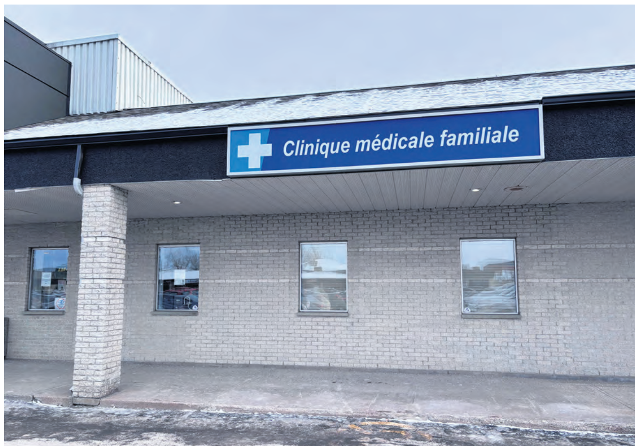
Le GMF Berthier-Saint-Jacques à Berthierville fait partie des cliniques qui ont accepté d'exposer leurs craintes publiquement.

Alors que certains changements entreront en vigueur dans quelques semaines à peine, soit le 1 er janvier 2026, l'hécatombe paraît de moins en moins évitable aux deux médecins. Départs précipités à la retraite, réorientation, absence de relève, exode du personnel de soutien vers d'autres milieux; les dégâts causés par le tsunami que