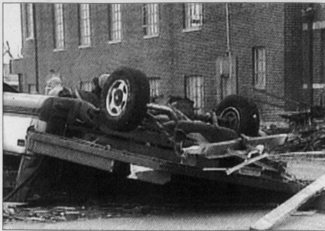
Cette image diffusée sur CNN illustre la force de la tornade qui a frappé samedi la petite ville de Greensburg, au Kansas, dont les habitations ont été détruites à 95 %.