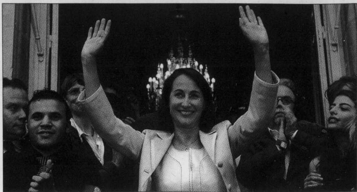
Ségolène Royal saluant ses partisans à la sortie de la Maison de l'Amérique latine, hier soir.