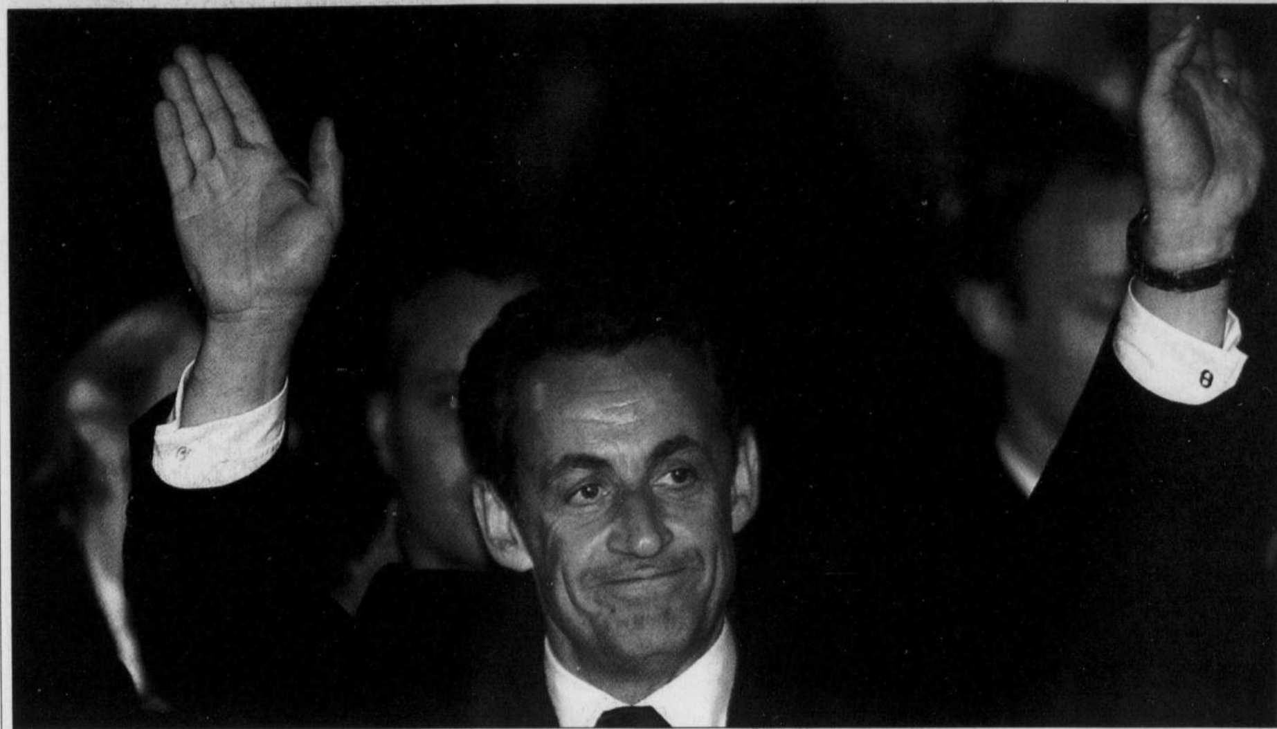
Nicolas Sarkozy a salué la foule en sortant du restaurant Fouquet's, sur les Champs-Élysées, à Paris, hier soir. Il a remporté 53,3 % des voix à l'élection présidentielle.