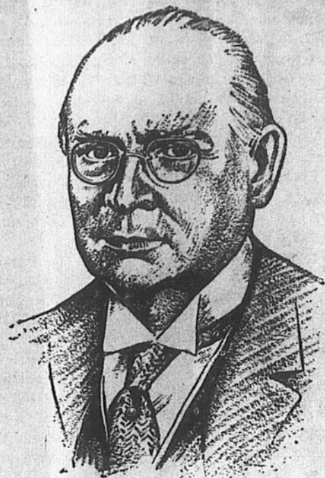
Le Très Hon. R. B. BENNETT, Premier Ministre du Canada