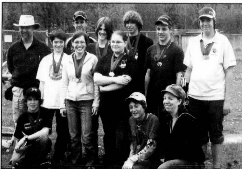
Cette dizaine de jeunes archers représenteront la région lors des prochains Jeux du Québec.

La région a connu son apogée à l'été 1999 à Alma avec une récolte de quatre médailles d'or, cinq d'argent et trois de bronze. Le site du tir à l'arc est situé près de la Polyvalente de la Forêt. Cette discipline est présentée lors du premier bloc des Jeux, soit du 6 au 9 août.