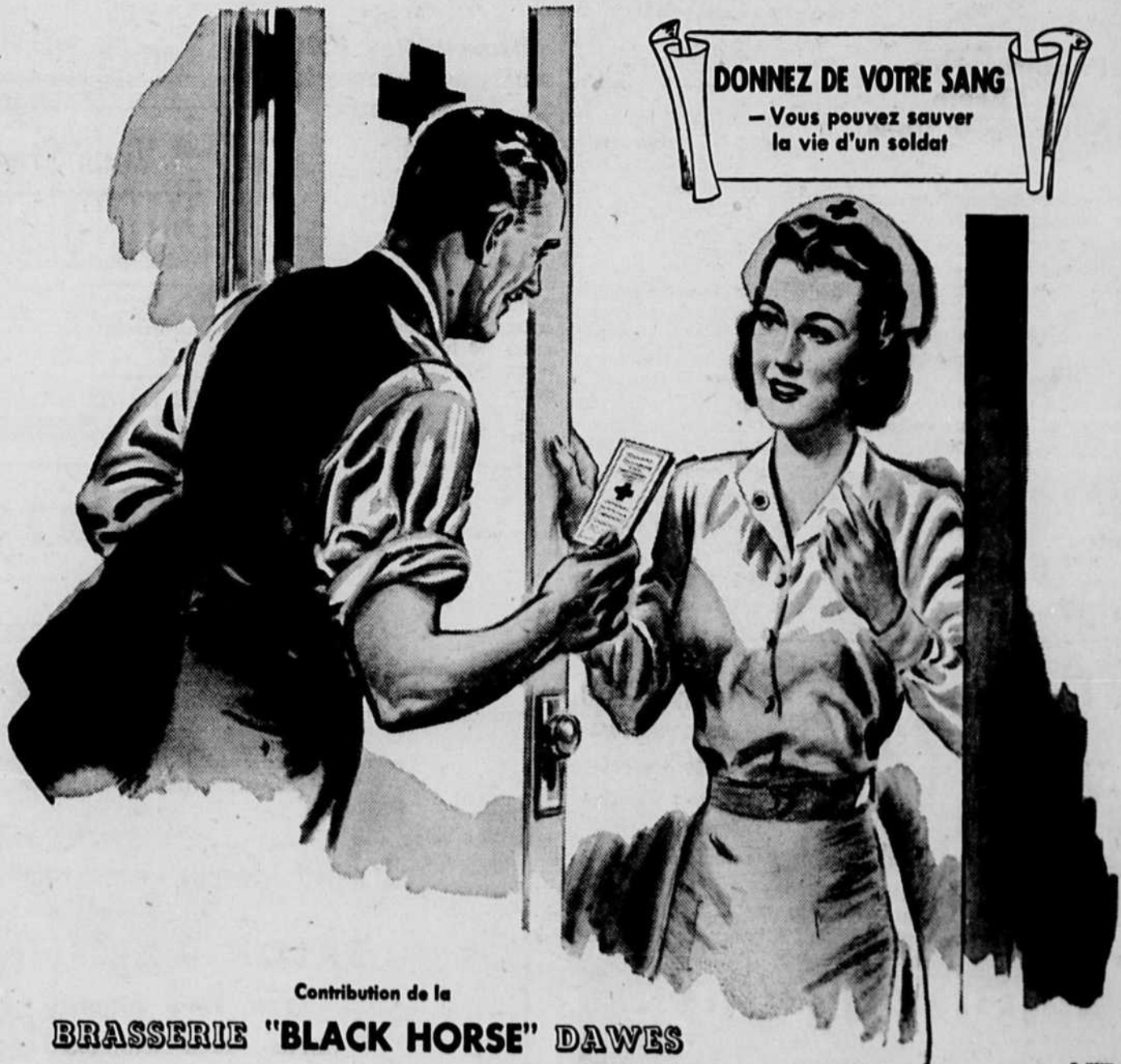
Contribution de la BRASSERIE "BLACK HORSE" DAWES

Ministère des Travaux publics, Ottawa, 21 mai 1945.