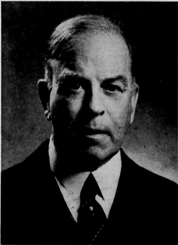
Le Très Honorable W. L. MACKENZIE KING

prolongées qui ont salué son arrivée et les principaux passages de son discours à la très nombreuse assemblée du Forum marquaient nettement combien notre population était heureuse de revoir le digne successeur de sir Wilfrid Laurier, heureuse de l'entendre.