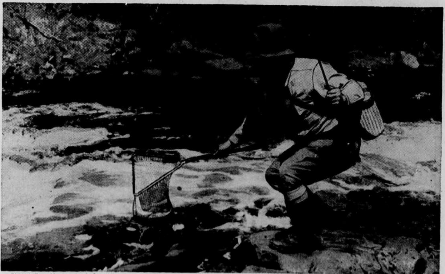
Pêche à la Truite Mouchetée dans les Laurentides