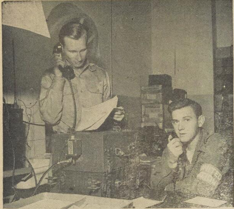
Notre photo montre comment se maintiennent en contact les équipes de surveillance des Nations Unies, réparties en des points parfois très éloignés les uns des autres, sur les fronts de batailles. Un réseau de postes de radio a permis de maintenir en observation continue les secteurs soumis à la trêve qui a ouvert la voie aux armistices signés depuis entre l'Etat d'Israël et les différents Etats Arabes.