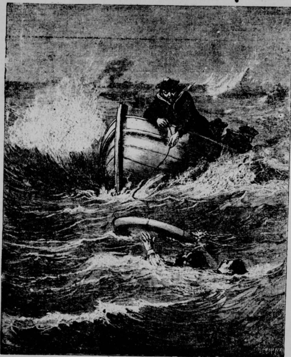
Faisons notre devoir, mes enfants. -- Page 302, col. 1.

On se mit en devoir de ressaisir les chaînes du