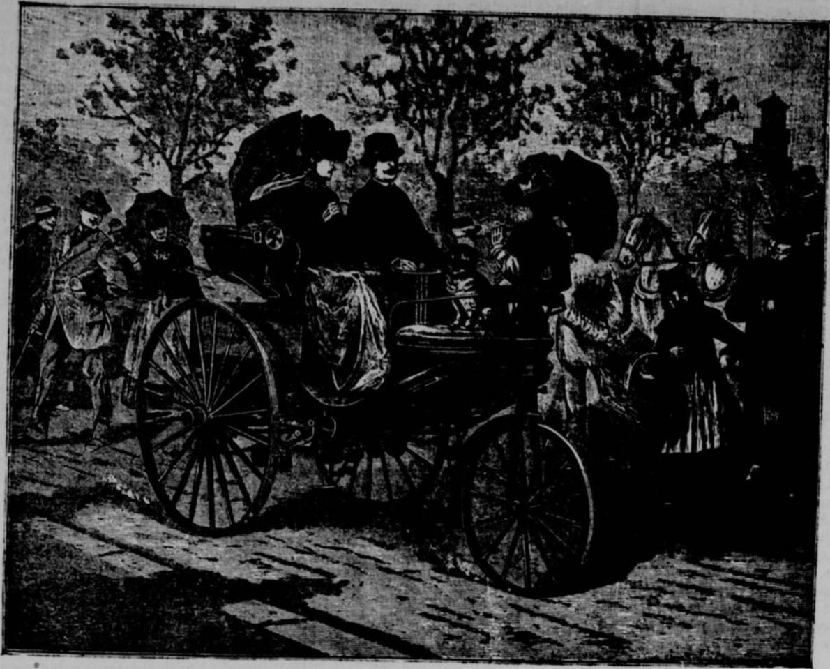
UNE VOITURE MISE EN MOUVEMENT PAR LE GAZ