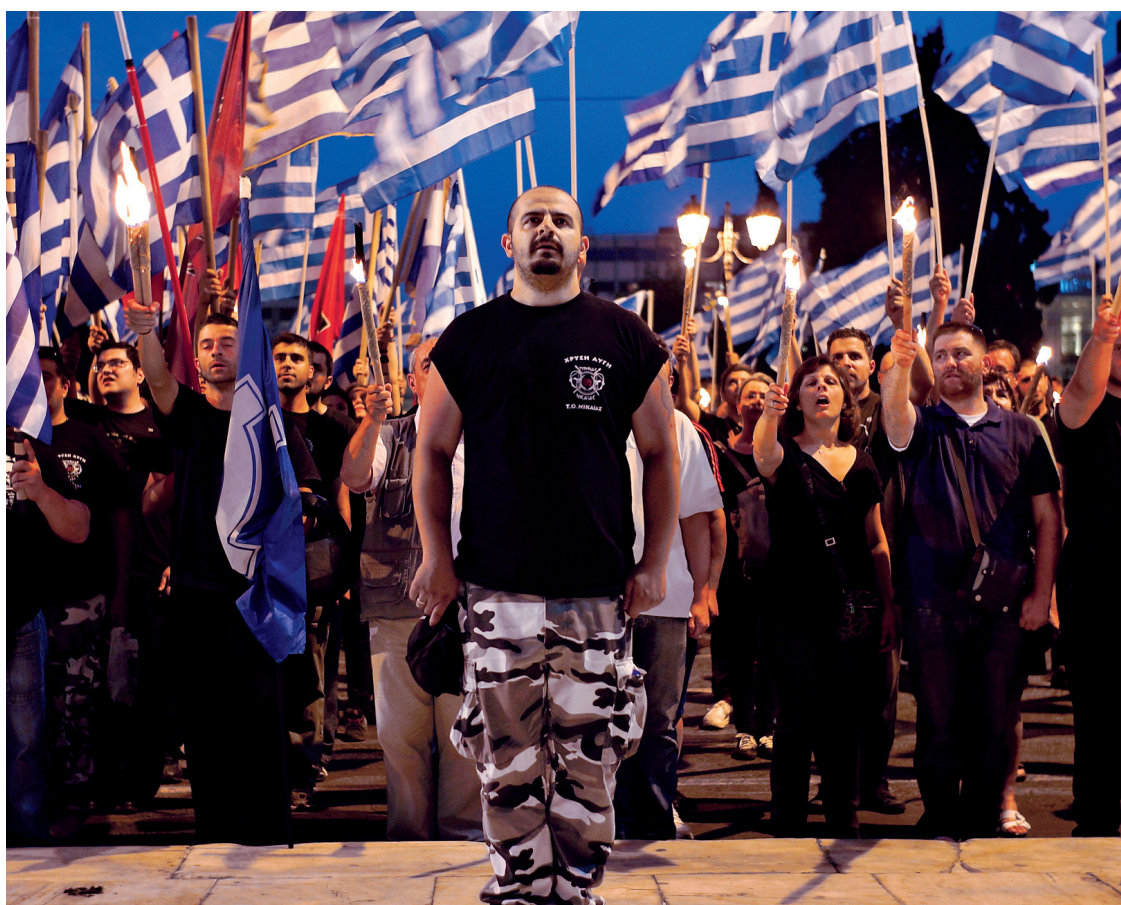
Des membres et sympathisants du parti Aube dorée chantant l'hymne national devant le parlement grec dans le centre d'Athènes, en mai dernier.

Or le parti néonazi est désormais crédité de la troisième place dans les intentions de vote, avec quelque 10% des voix, contre 7% lors de son irruption au parlement en mai 2012.