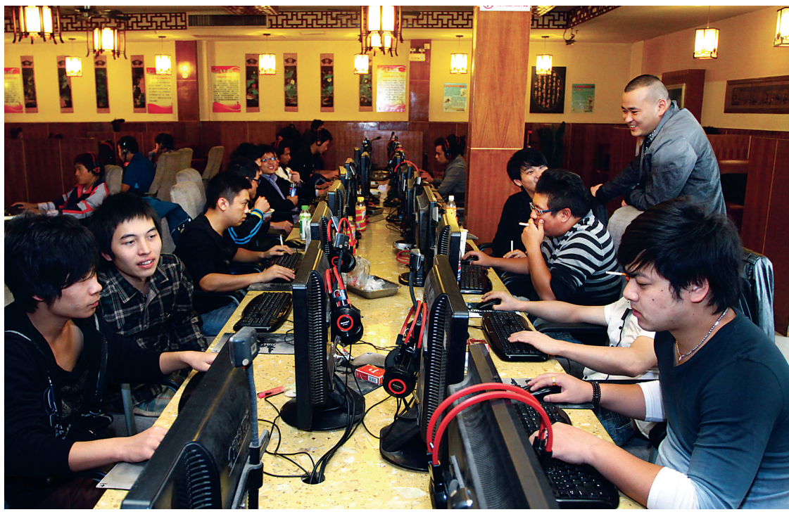
Cybercafé à Jiashan, ville côtière située dans la province du Zhejiang.