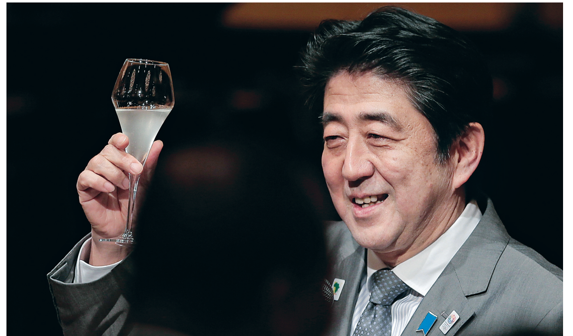
Le premier ministre japonais, Shinzo Abe, lève son verre pour célébrer les annonces faites durant la conférence internationale de Tokyo pour le développement de l'Afrique (Ticad).

Cette assistance sera consacrée à «l'alimentation, l'éducation et la santé, avec également