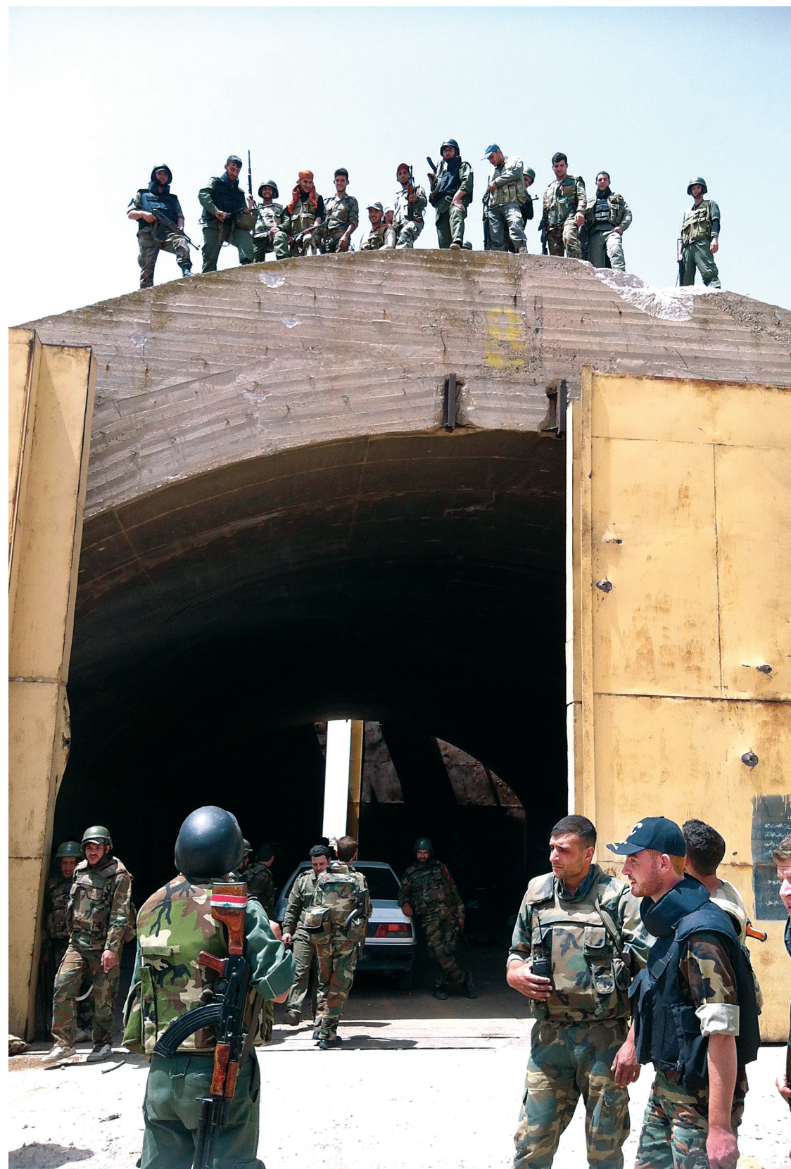
Cette photo, prise avec un cellulaire, montre des soldats de l'armée syrienne qui se tenaient devant un hangar à Qoussair, dimanche.

François Brousseau est chroniqueur d'information internationale à Radio-Canada. On peut l'entendre tous les jours à l'émission Désautels à la Première Chaîne radio.