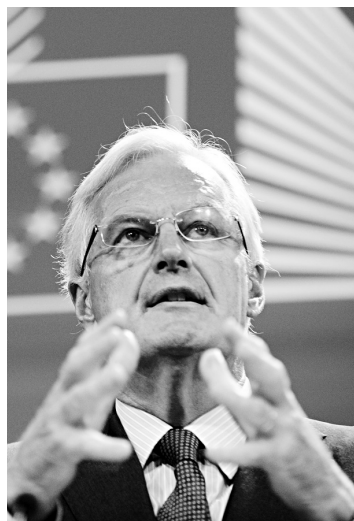
Michel Barnier, commissaire européen en charge des Services financiers