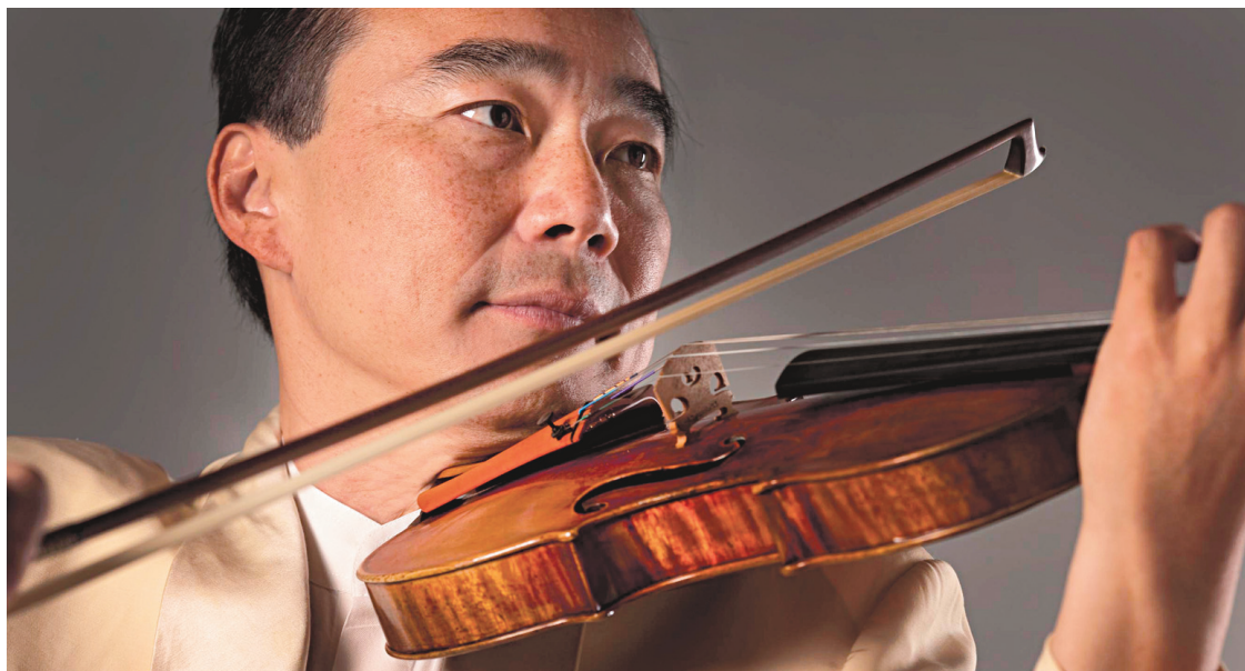
Le violoniste Cho-Liang Lin interprétera l'intégrale des 5 concertos pour violon de Mozart lors du Festival.

Ce sont de très grandes œuvres de l'histoire de la musique de chambre que Denis Brott a mises au programme: le Quatuor pour piano de Schumann