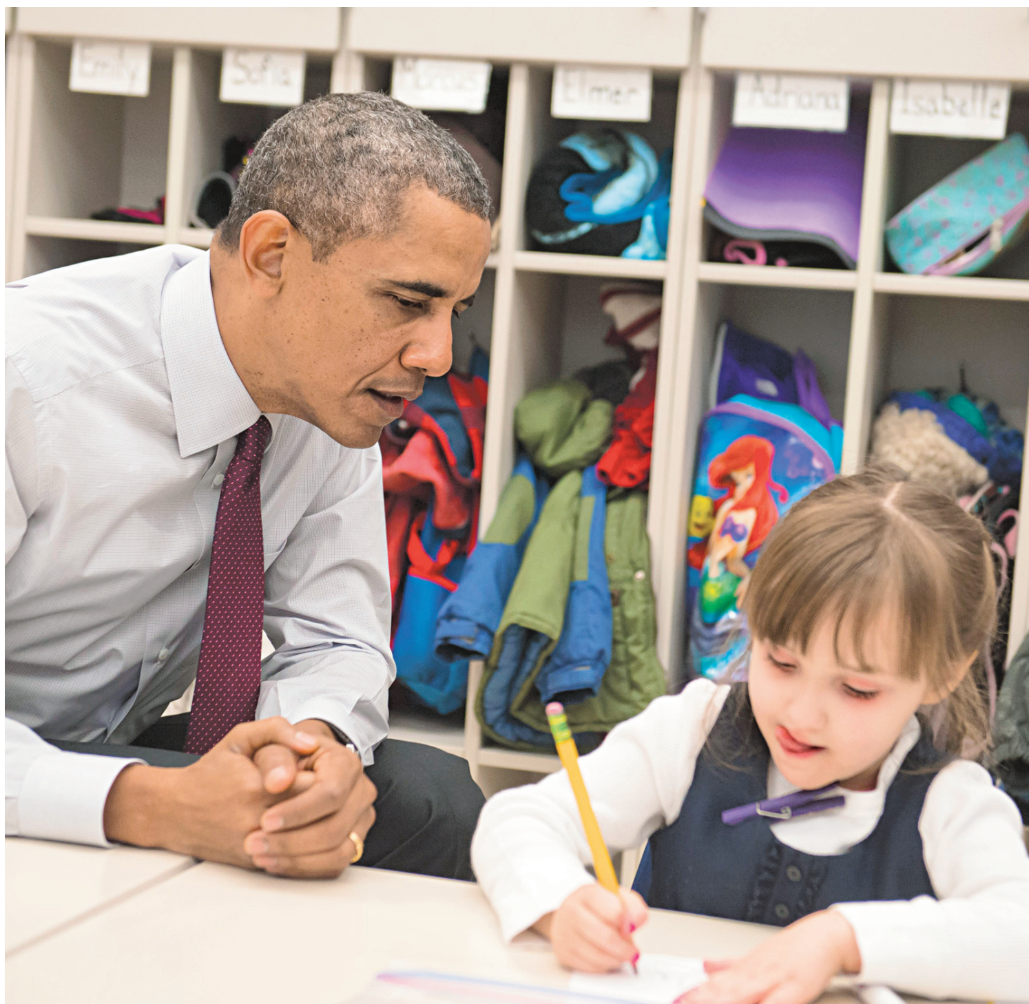
Barack Obama s'est rendu dans une école primaire, à Washington, pour entretenir la presse de son projet de budget déposé un peu plus tôt et qui n'a aucune chance d'être adopté tel quel.