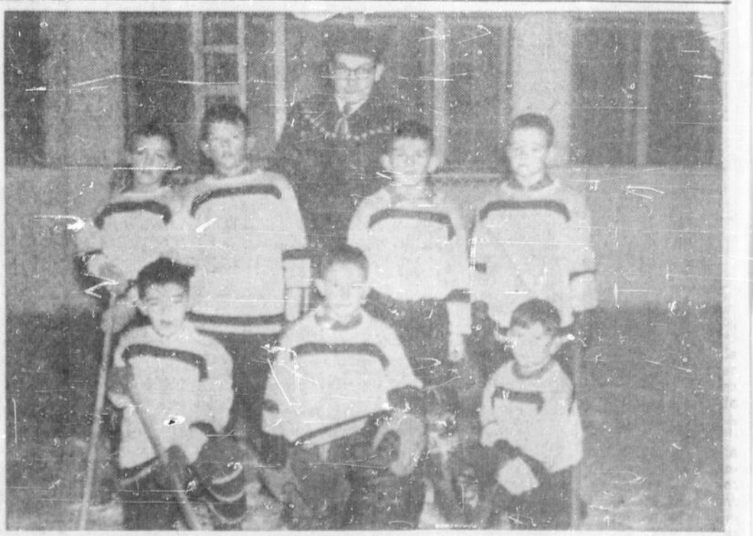
LES PETITS DE LA LIGUE INTERSCOLAIRE ont démontré beaucoup d'entraide et quelques-uns laissent prévoir un brillant avenir. Ce sont les Braves de l'école publique qui ont remporté le trophée, décerné par le garage Mattawa. Sur cette photo, on reconnaît les