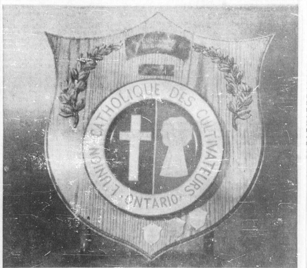
TROPHEE DE L'UCC — Cette plaque destinée au cercle qui a recruté le plus grand nombre de membres pour l'Union catholique des cultivateurs du diocèse du Saul-St-Marie, à l'occasion d'un concours inter-paroissial de recrutement, sera présentée au

WASHINGTON (PA) — Le premier ministre Macmillan de Grande-Bretagne arrivera à Washington en fin de semaine pour des entretiens avec le président Eisenhower sur la plus récente proposition de la Russie au sujet de l'interdiction des essais nucléaires et des questions s'y rattachant.