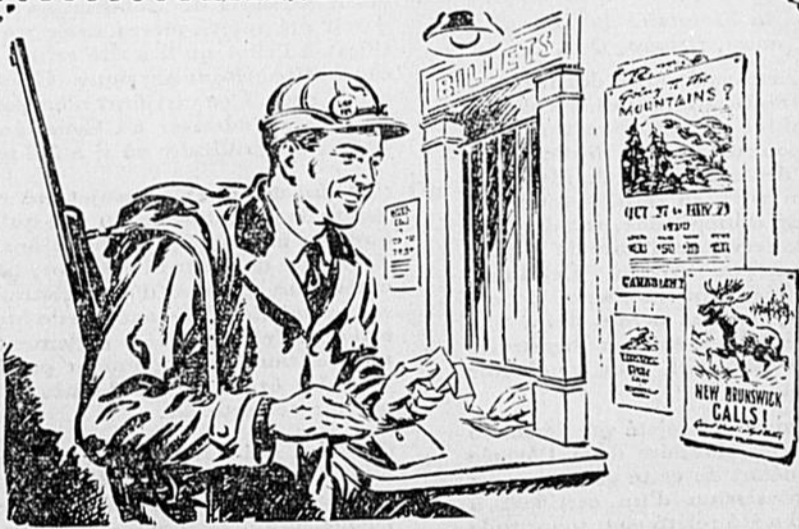
AVANT LA GUERRE: Jules n'hésitait pas à dépenser $100 pour un voyage de chasse et, pour rien au monde, il n'aurait voulu se priver de ce plaisir.