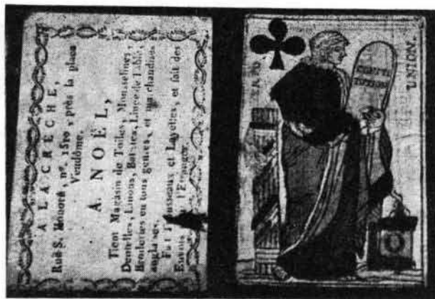
Cartes à jouer commerciales, en France