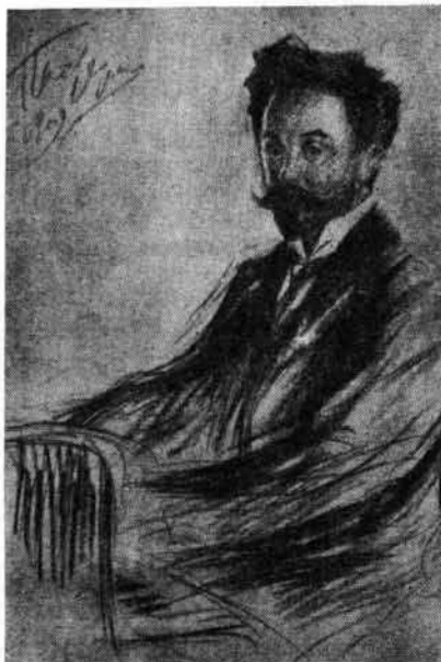
ALEXANDRE SCRIABINE, d'après le peintre russe Pasternack.

Par une coïncidence peut-être significative, Alexandre Scriabine et Nicolas Medtner naquirent tous deux à Moscou et le Jour de Noël, le premier en 1871 et le second en 1879. La mère du jeune Scriabine, pianiste remarquable, étant morte alors qu'il n'avait que deux ans, il fut confié à sa grand-mère paternelle et à une tante qui lui enseigna les éléments musicaux.