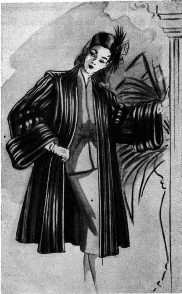
ILLUSTRATION CHAS DESJARDINS MONTREAL