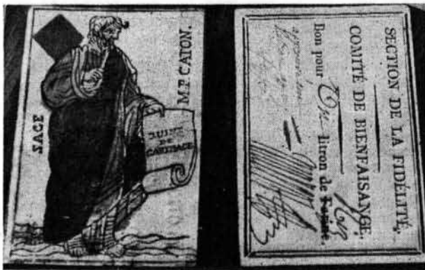
Cartes à jouer sous la Révolution

En 1793, les choses se corsent. Cette fois, le bonnet phrygien est sur toutes les têtes. Les rois se transfor-