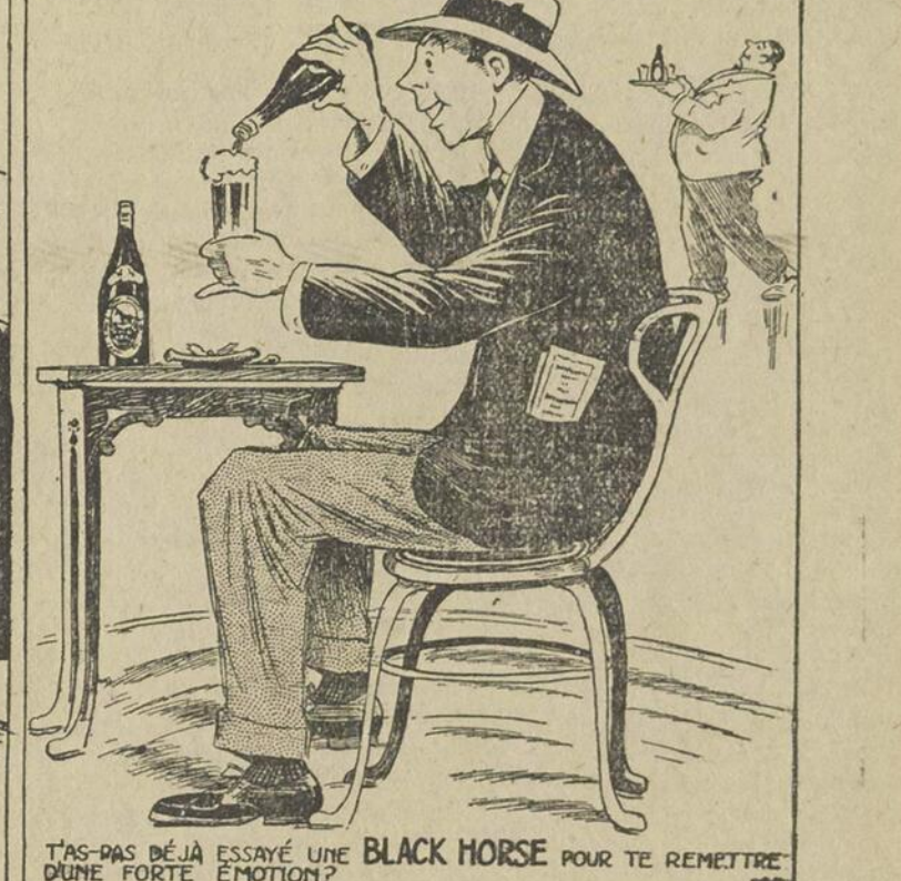
T'AS-PAS DÉJÀ ESSAYÉ UNE BLACK HORSE POUR TE REMETTRE D'UNE FORTE ÉMOTION?

dites simplement — "Bière Black Horse Dawes s.v.p.!"