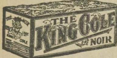
Et le Café King Cole vous réglera aussi

La force est sans doute une bonne qualité pour le. Il en est de même de l'arome et de la richesse. Mais il se peut qu'il soit trop fort, d'un arôme trop prononcé, et d'un goût trop piquant. En mélangeant un thé fort que nous trouvons dans les Indes du Nord avec un thé à l'arome prononcé, la crème, peut-être, d'une certaine récolte de Ceylan, et le thé d'une richesse unique, qui vient d'un fameux jardin d'Assam, nous obtenons juste assez de force, un degré d'arôme suffisant et une richesse et une saveur parfaites. Bref, nous obtenons le THE KING COLE. Vous savez fort bien que le THE KING COLE sera le même l'année prochaine que cette année. Mais nous, nous ne savons jamais d'une année à l'autre ou nous pourrions trouver les thés que nous utilisons pour le mélange.