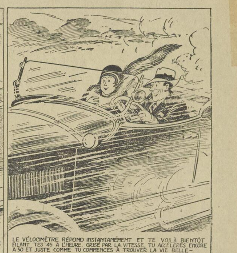
LE VELOCIMÈTRE RÉPOND INSTANTANÉMENT ET TE VOILÀ BIENTÔT FILANT TES 45 À L'HEURE. GRÊCE PAR LA VITESSE, TU ACCELERES ENCORE À 50 ET JUSTE COMME TU COMMENCES À TROUVER LA VIE BELLE —