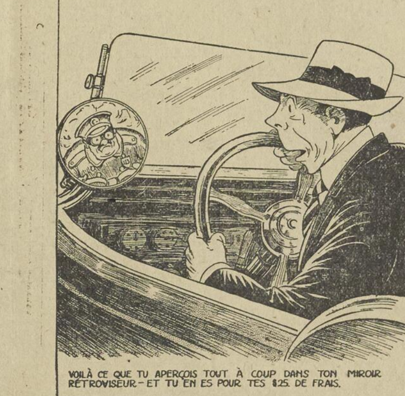
VOILÀ CE QUE TU APERÇOIS TOUT À COUP DANS TON MIROIR RÉTROVISEUR — ET TU EN ES POUR TES 825 DE FRAIS.