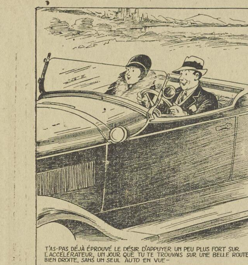
T'AS-PAS DÉJÀ ÉPROUVÉ LE DESIR D'APPUYER UN PEU PLUS FORT SUR L'ACCELERATEUR, UN JOUR QUE TU TE TROUVES SUR UNE BELLE ROUTE BIEN DROITE, SANS UN SEUL AUTO EN VUE —