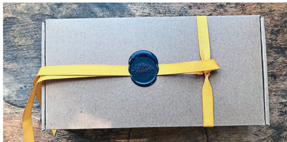
Millésimé et numéroté, chaque gâteau aux fruits Tamarack est inséré dans une jolie boîte ornée d'un ruban jaune et d'un tampon de cire.

À moyen terme, le Montréalais compte également transformer ce qui est aujourd'hui une chambre froide en une cuisine communautaire à la disposition de la population du village et des environs. «Ça sera une petite cuisine, mais aux normes du MAPAQ que j'utiliserai pour cuisiner mes gâteaux aux fruits. Mais comme je n'en ai besoin que deux mois par année, elle sera disponible le reste du temps pour la location.»