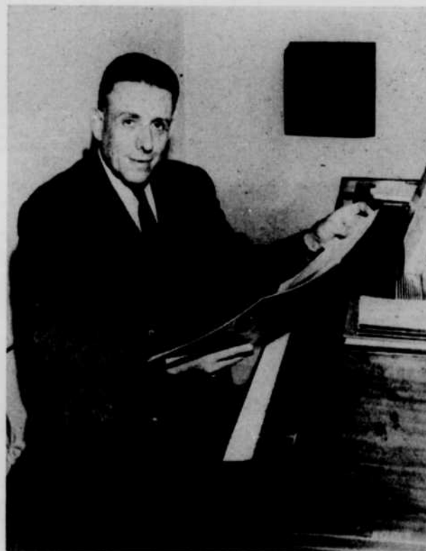
FRANCIS POULENC dans son studio de Paris

Francis Poulenc, Darius Milhaud et Arthur Honegger se placent aujourd'hui en tête de la musique française contemporaine. Il y a trente ans, ils faisaient tous trois partie du groupe connu sous le nom Les Six et qui comprenait également Germaine Tailleferre, Georges Auric et Louis Durey. Avec Jean Cocteau et Erik Satie, ils proclamaient que la musique française devait se libérer de l'impres-