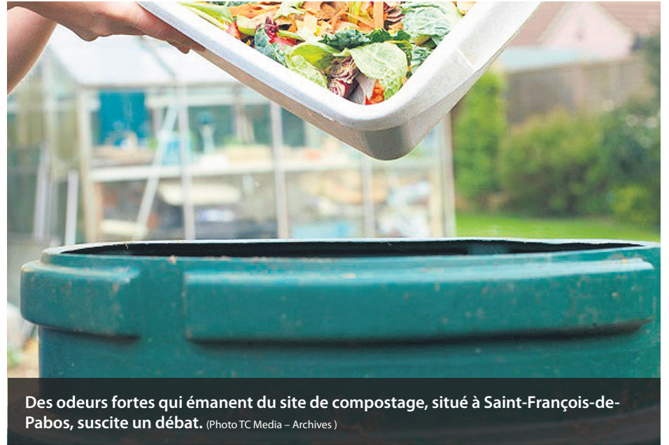
Des odeurs fortes qui émanent du site de compostage, situé à Saint-François-de-Pabos, suscite un débat.