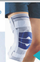
Orthèse du genou