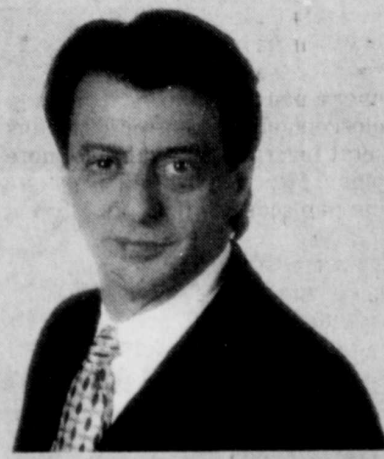
Jean-Luc Mongrain analyse avec vous l'actualité et les dossiers chauds du moment. Lundi à vendredi 17 h 55