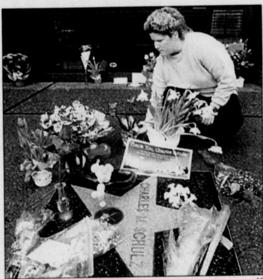
Cette fan est venue déposer des fleurs sur « l'étoile » de Charles Schulz, à Santa Rosa.